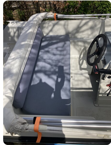
Big Fish 470 msp768487 10