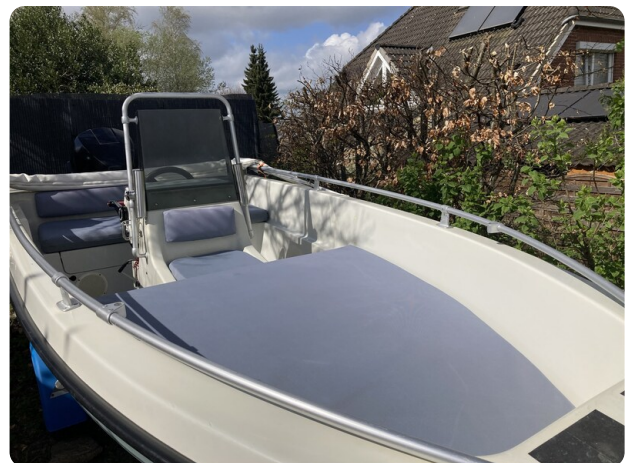
Big Fish 470 msp768487 6