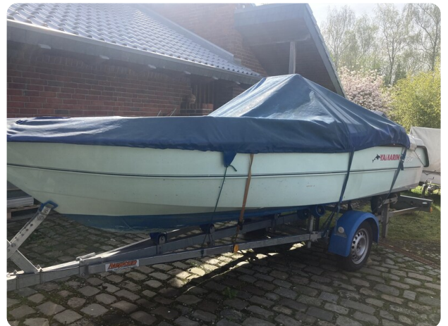
Big Fish 470 msp768487 4