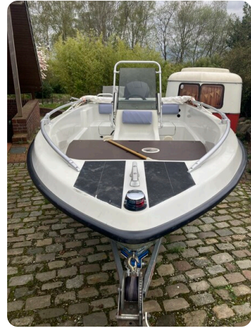
Big Fish 470 msp768487 2