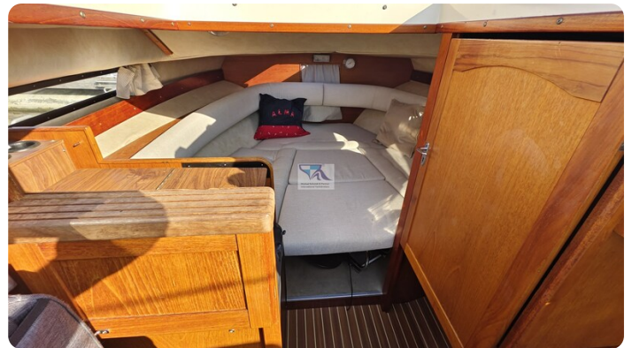
Windy 25 MIRAGE msp790159 21