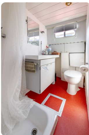
15m Stahlmotoryacht BERDA 11