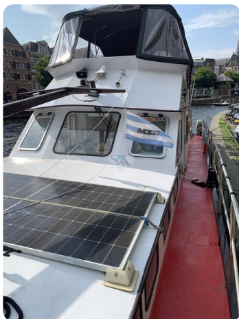
15m Stahlmotoryacht BERDA 32