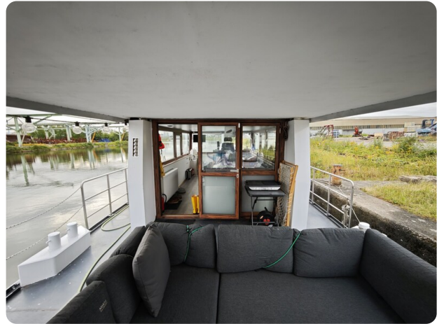
MY GINO 22