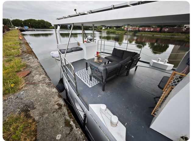
MY GINO 5