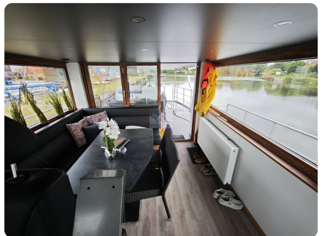
MY GINO 26