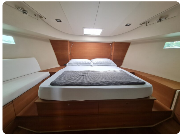
Vismara Bwave master cabine