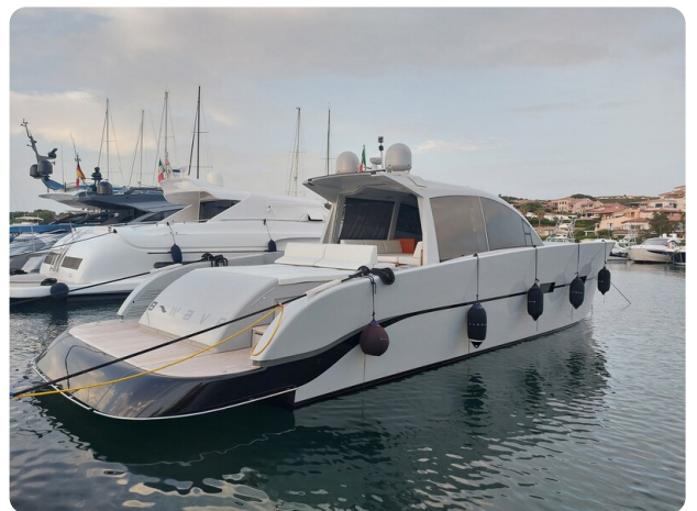
Vismara Bwave profile3