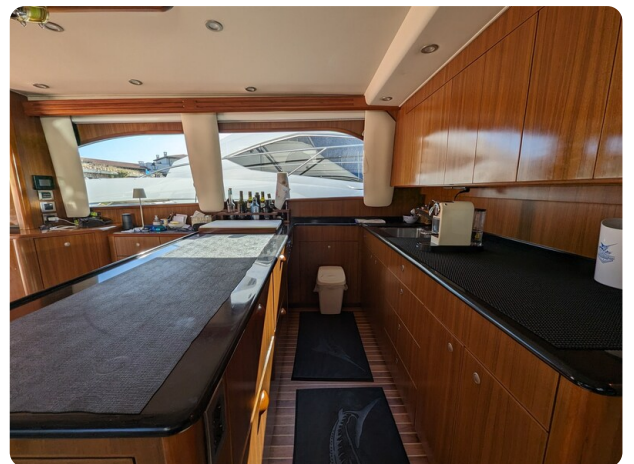
Viking 54 Convertible galley