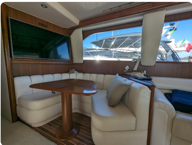
Viking 54 Convertible dinette detail