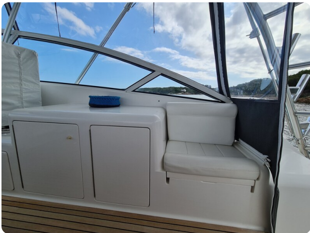
Viking 45 Open, cockpit bar