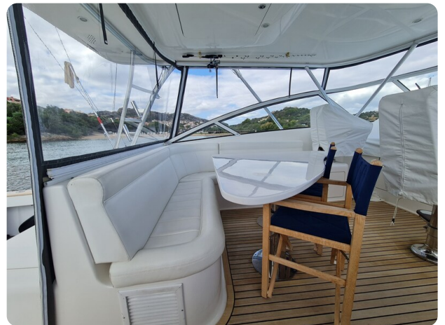
Viking 45 Open, cockpit dinette