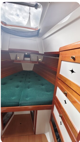
Helena 35 4