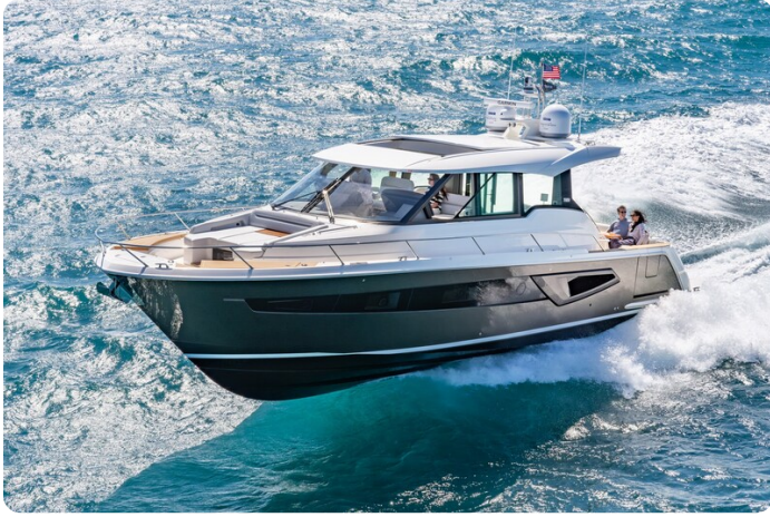
Tiara EX54 running