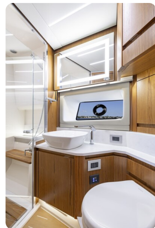
Tiara EX54 bathroom