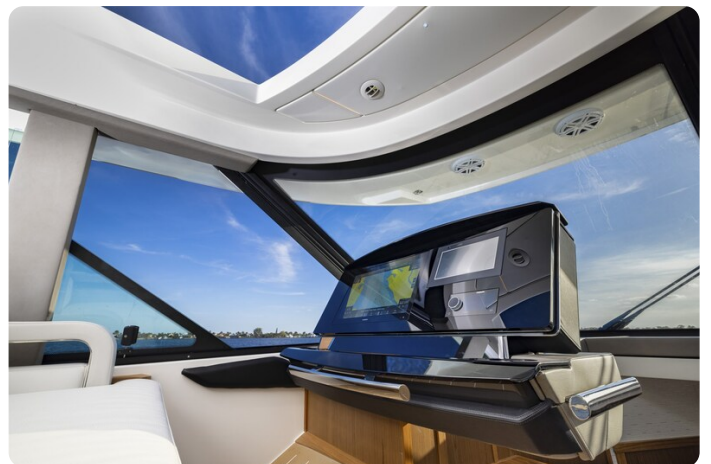
Tiara EX54 Companion Helm