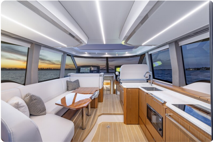
Tiara EX54 salon