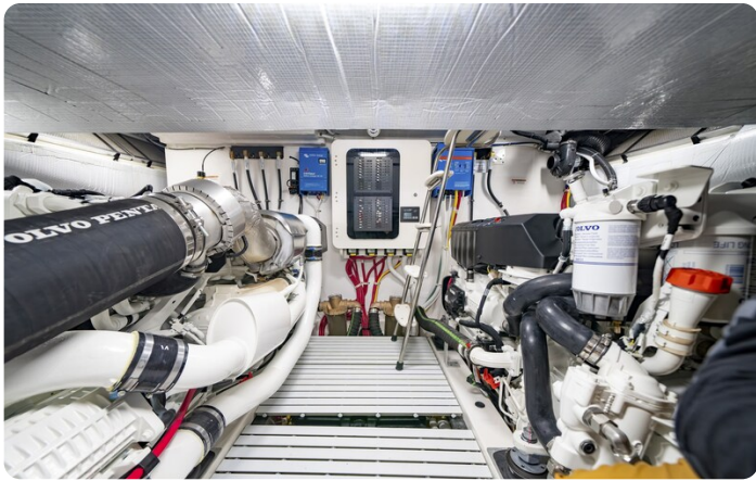
Tiara EX54 engine room