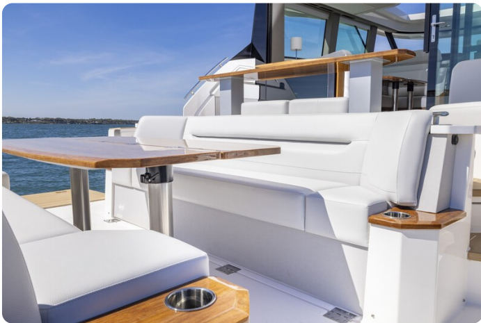
Tiara EX54 Aft Cockpit Lounge