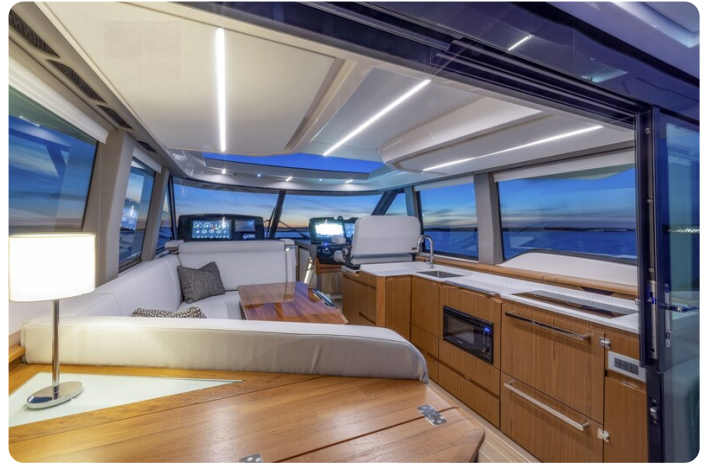
Tiara EX54 galley