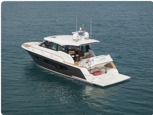
Tiara EX54 aft view