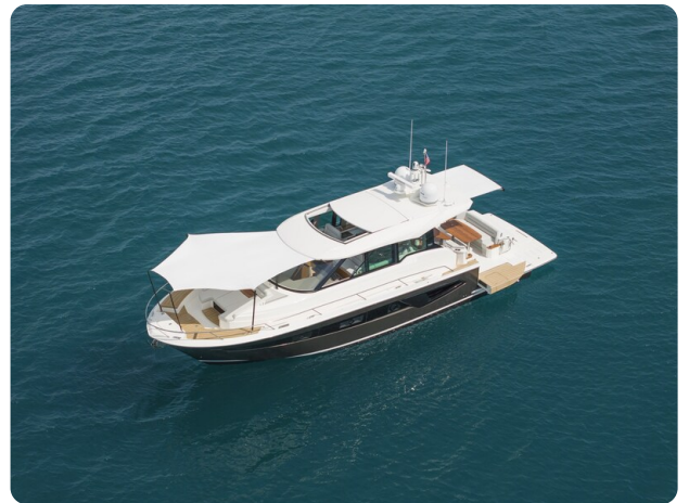
Tiara EX54 anchored