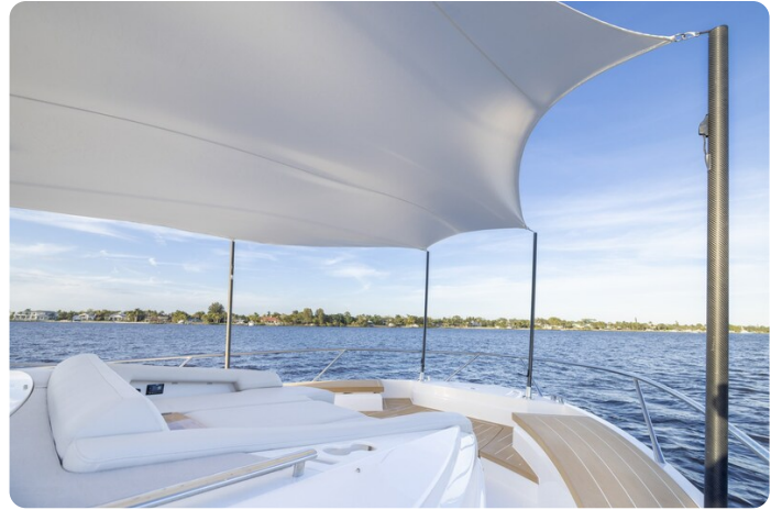
Tiara EX54 bow sunshade