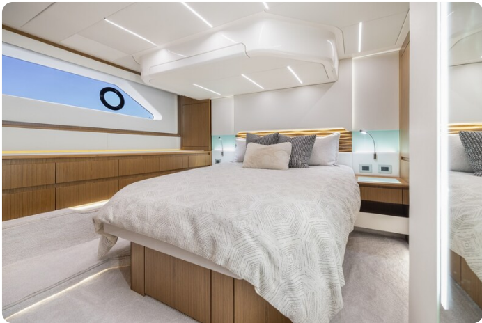
Tiara EX54 owner's cabin