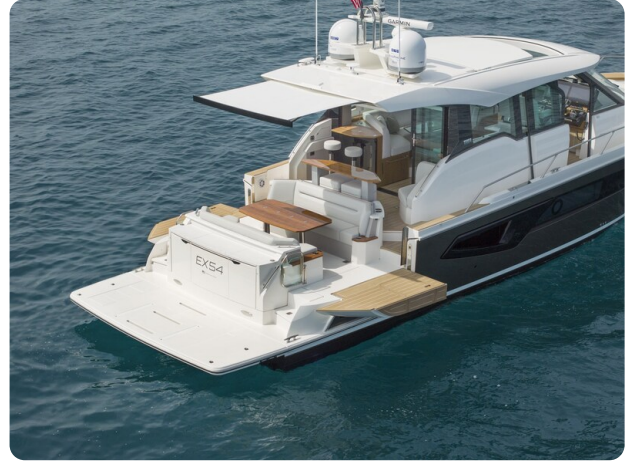
Tiara EX54 cockpit view