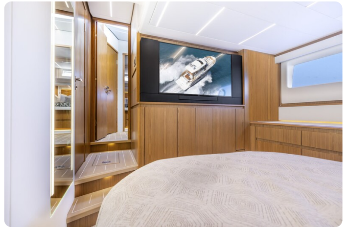
Tiara EX54 owner's cabin detail