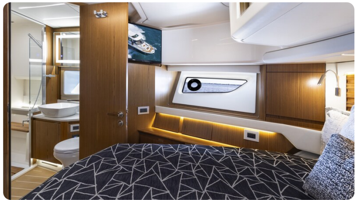
Tiara EX54 Vip cabin detail