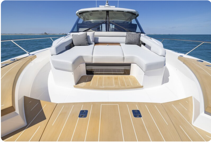
Tiara EX54 bow deck