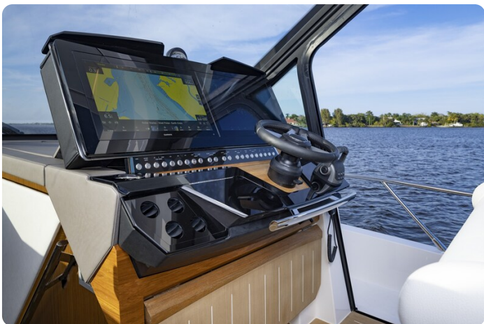
Tiara EX54 helm station