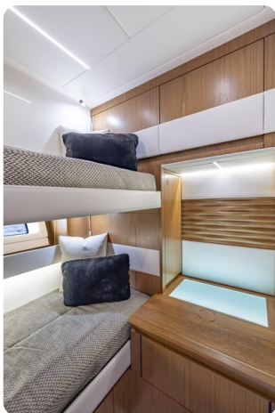
Tiara EX54 guest cabin