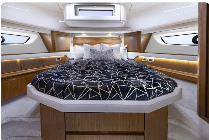
Tiara EX54 VIP cabin