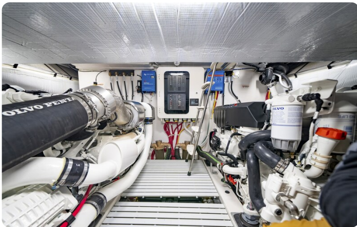
Tiara EX54 engine room