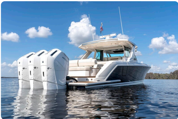
Tiara 48LS aft profile