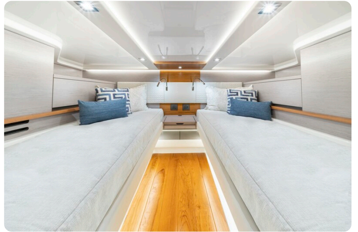
Tiara 48LS guest cabin