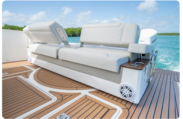
Tiara 48LS aft seats