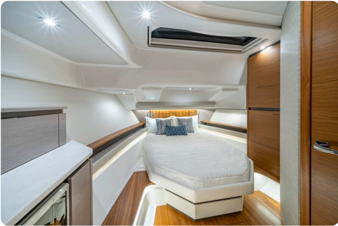
Tiara 48LS fwd cabin