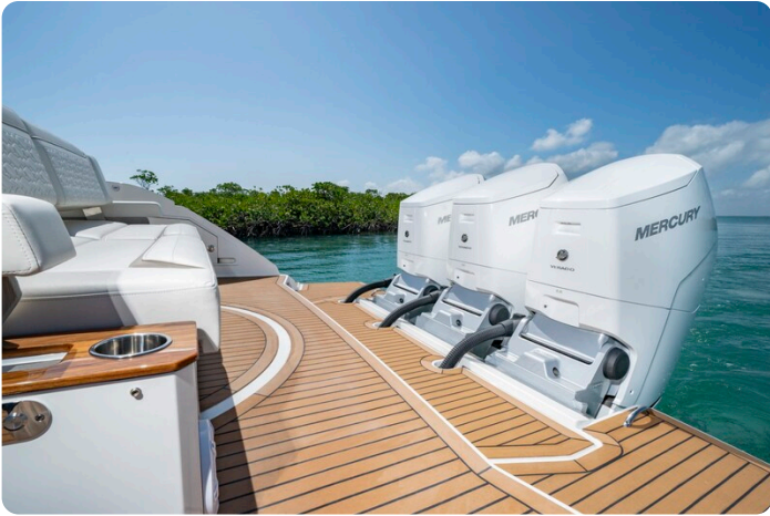
Tiara 48LS aft platform