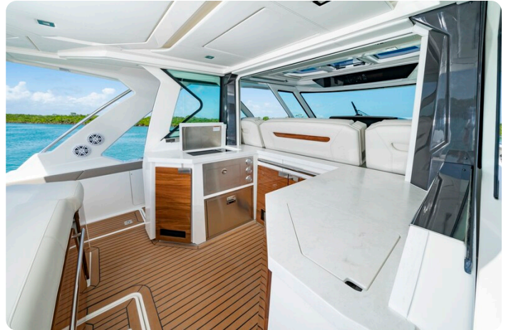
Tiara 48LS cockpit galley