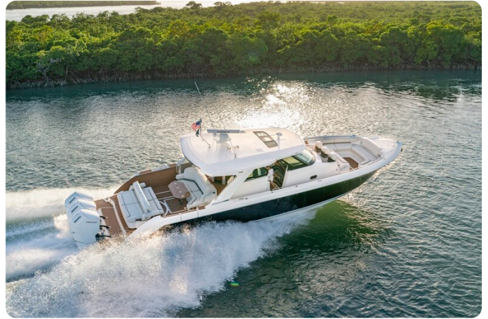
Tiara 48LS running 2