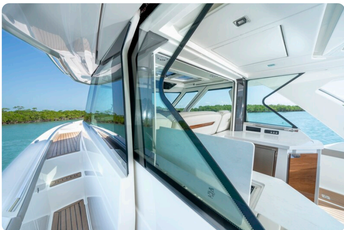
Tiara 48LS sideways