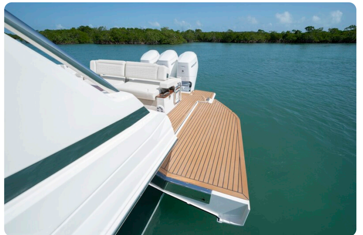
Tiara 48LS side platform