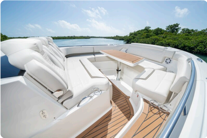
Tiara 48LS fwd dinette detail