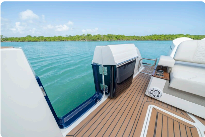
Tiara 48LS side door