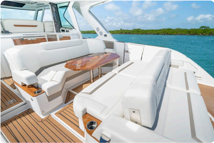
Tiara 48LS aft dinette