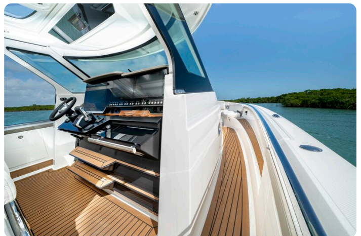
Tiara 48LS helm station detail