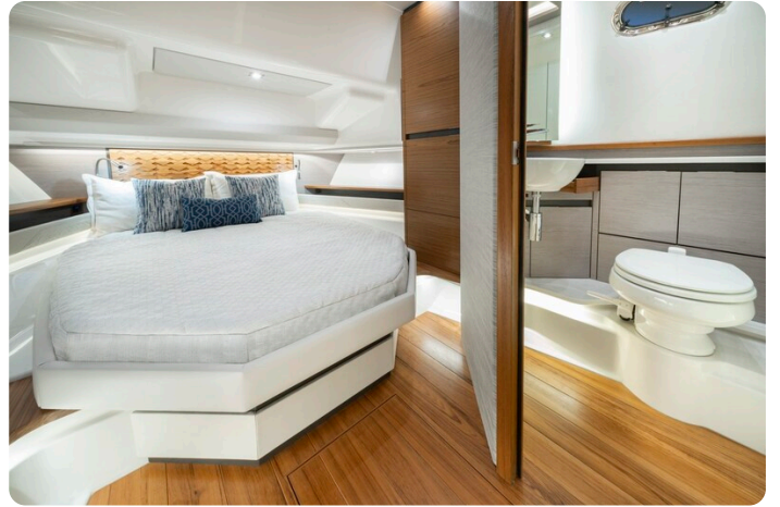
Tiara 48LS fwd berth