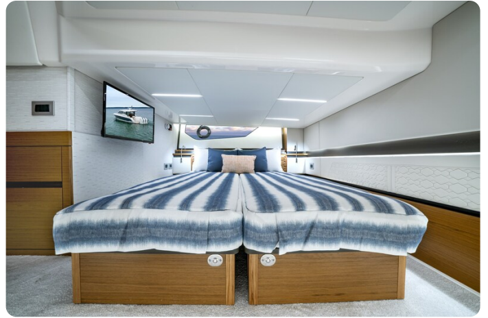
Tiara 48LE guest cabin berth conversion