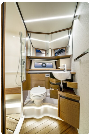
Tiara 48LE bathroom