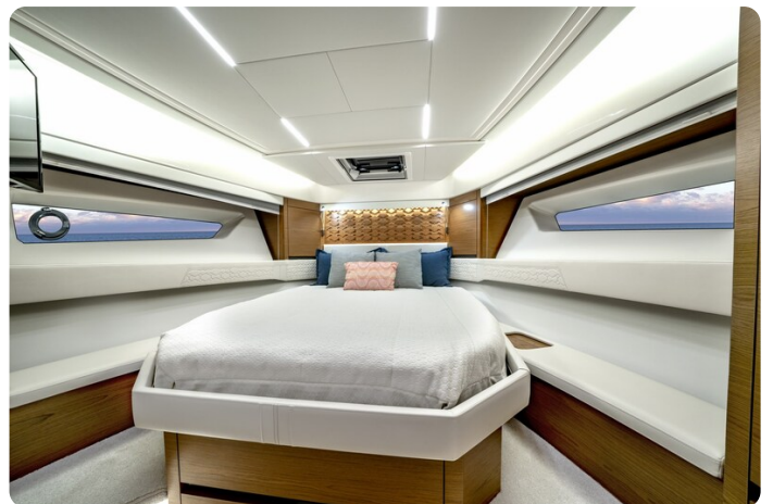
Tiara 48LE master cabin