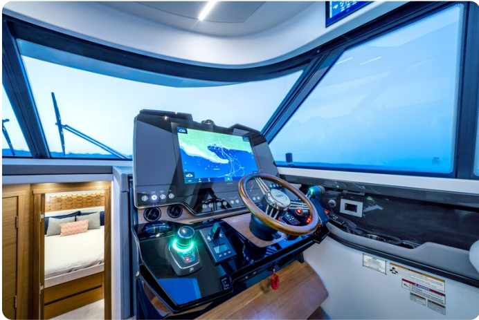
Tiara 48LE helm station