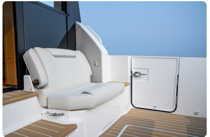
Tiara 48LE cockpit detail