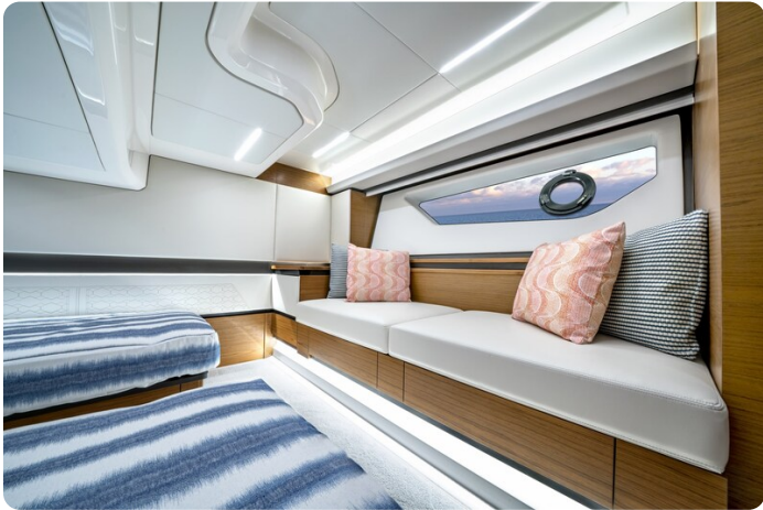
Tiara 48LE guest cabin detail