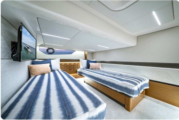
Tiara 48LE guest cabin