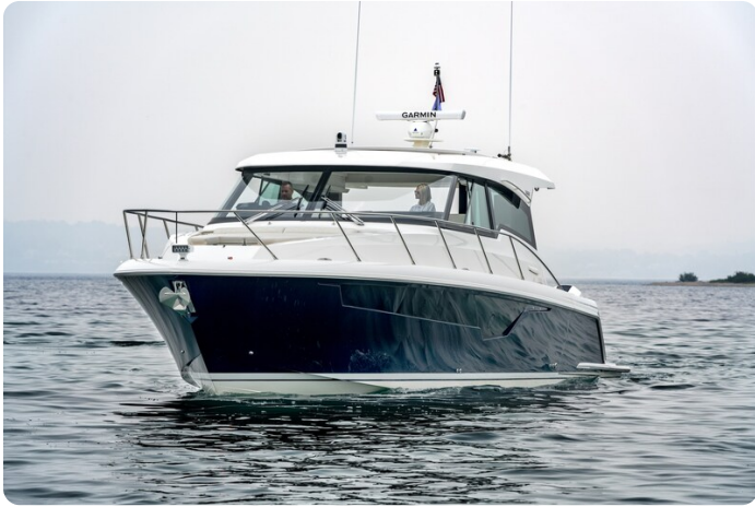
Tiara 48LE bow view