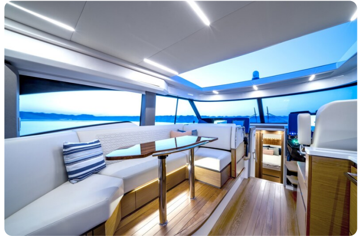
Tiara 48LE salon