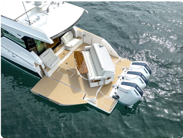
Tiara 48LE terrace detail