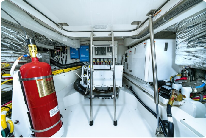
Tiara 48LE engine room detail