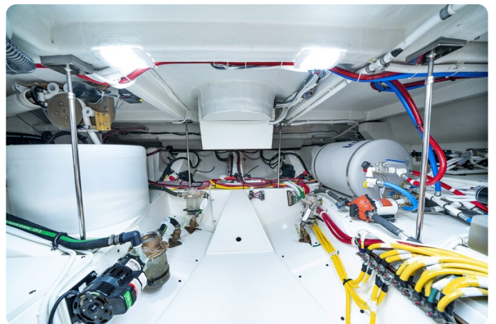
Tiara 48LE engine room