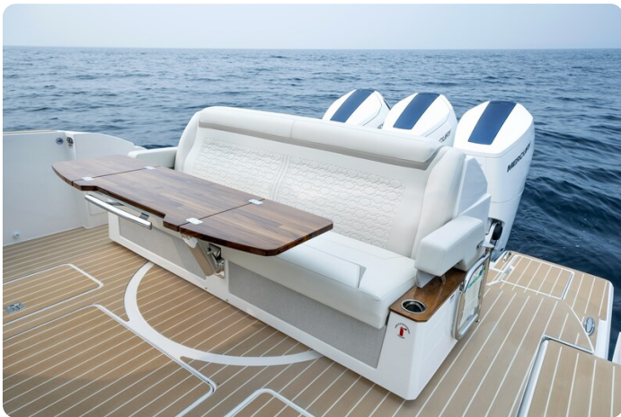
Tiara 48LE cockpit dinette