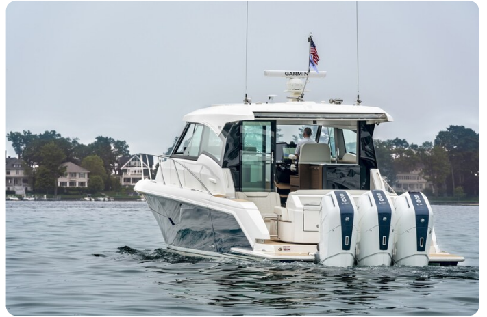
Tiara 48LE aft view