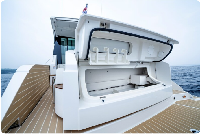
Tiara 48LE transom detail