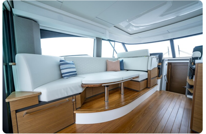
Tiara 48LE dinette