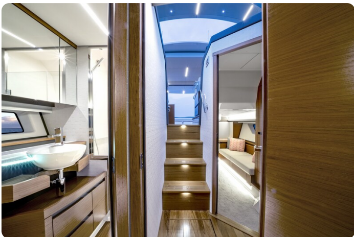
Tiara 48LE interiors