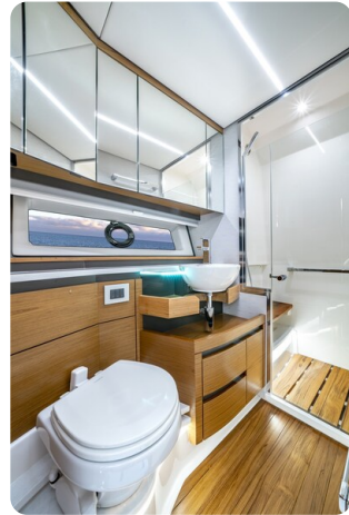
Tiara 48LE head and shower