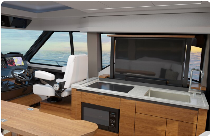
Tiara 43LE galley with TV up