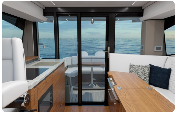
43le-rendering-interior-Salon with Doors Closed