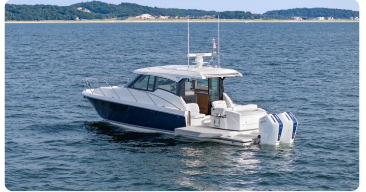
43 LE Nav