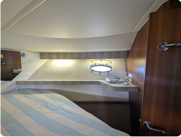
Tiara 4100 Open owner's cabin detail