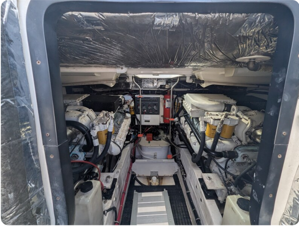
Tiara 4100 Open engine room