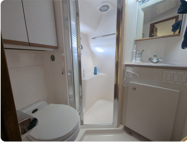
Tiara 4100 Open head view