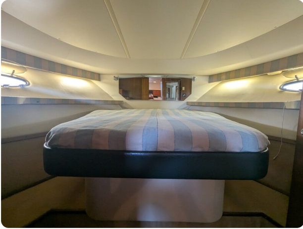
Tiara 4100 Open owner's cabin