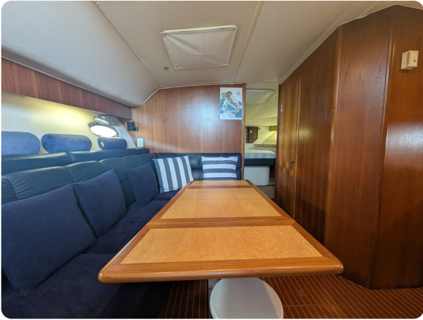
Tiara 4100 Open interiors