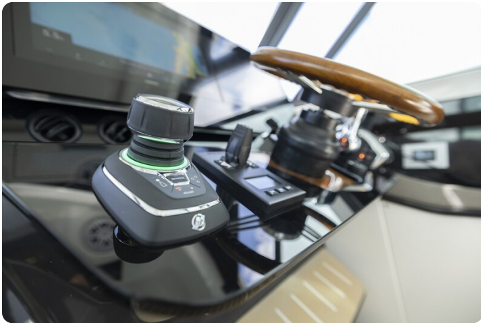
{1} Helm detail