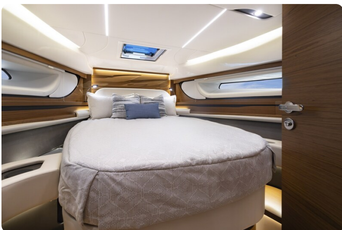
{1} Master cabin