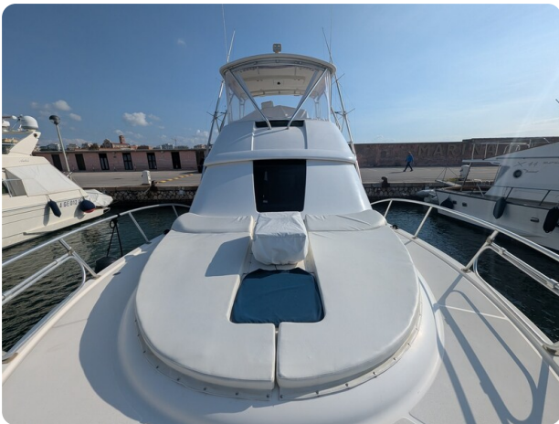
Tiara 3900 Conv. bow deck