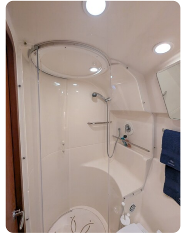
Tiara 3900 Conv. shower stall