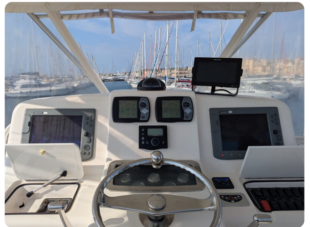
Tiara 3900 Conv. Helm station