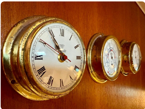
Tiara 3800 Open Detail