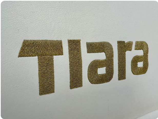
Tiara 3800 Open New Logo Detail