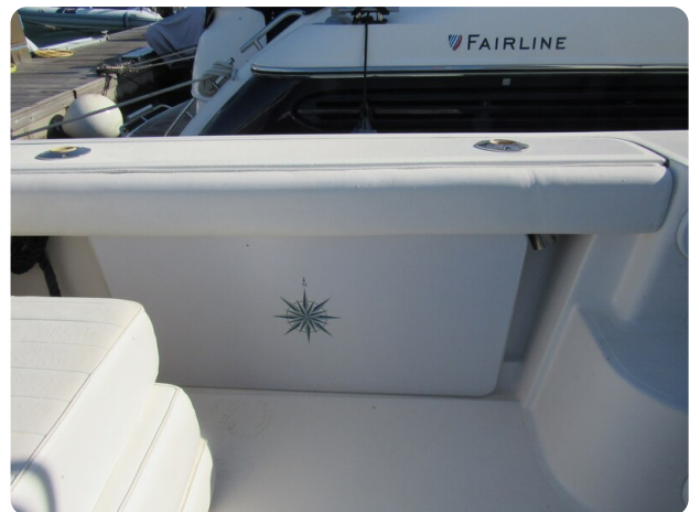
Tiara 3800 Open, cockpit detail