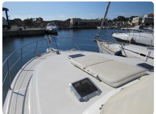
Tiara 3800 Open Bow Sunpad