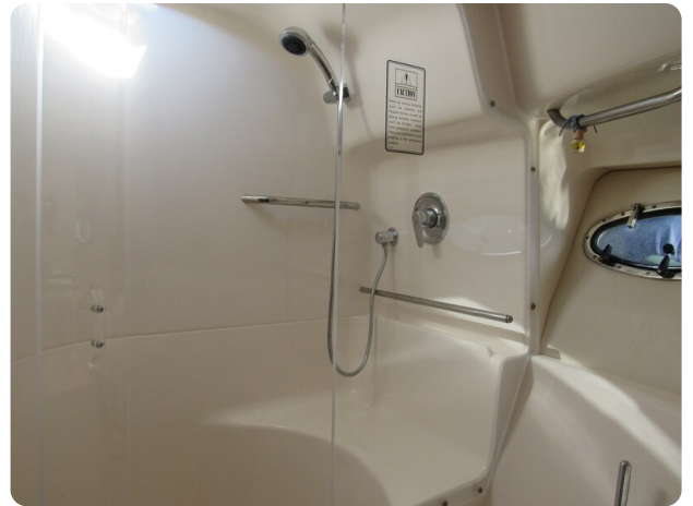
Tiara 3800 Open, shower stall