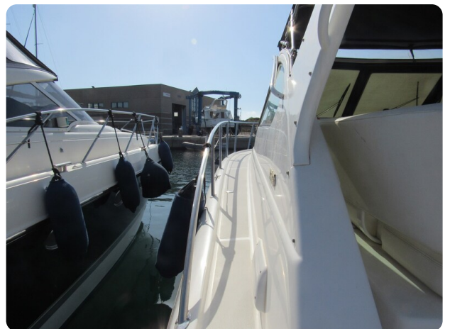
Tiara 3800 Open, sideways