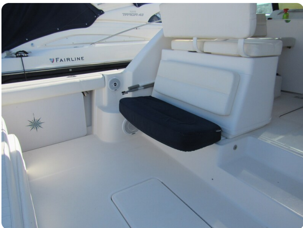
Tiara 3800 Open, cockpit aft seat