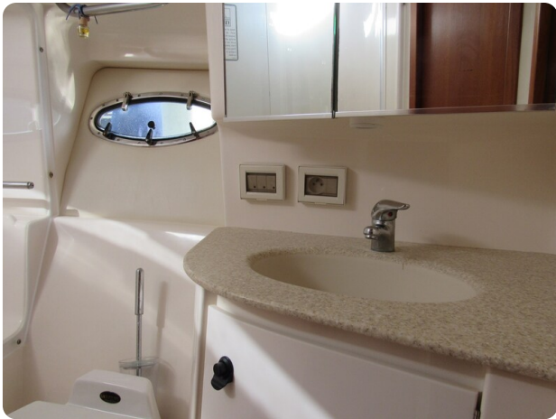
Tiara 3800 Open, bathroom