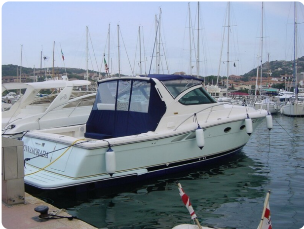
Tiara 3800 Open Valerio lato poppa