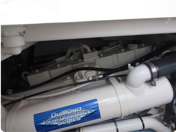
Tiara 3800 Open, engine detail