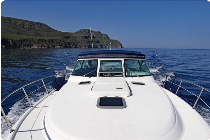
Tiara 3800 Open Effetto Cupido 1