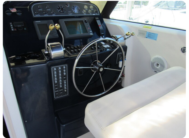
Tiara 3800 Open, helm station