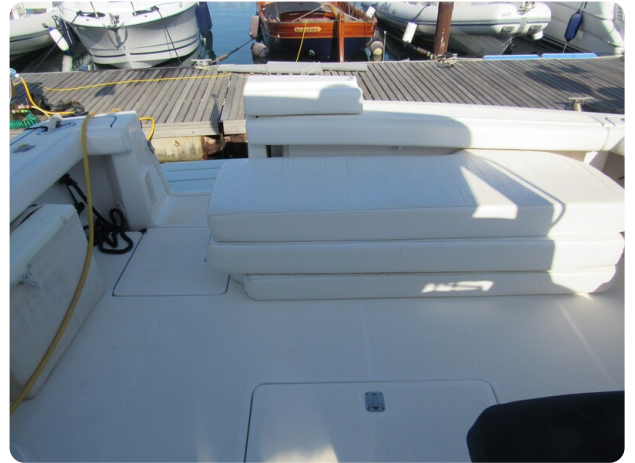
Tiara 3800 Open, cockpit with sunpads