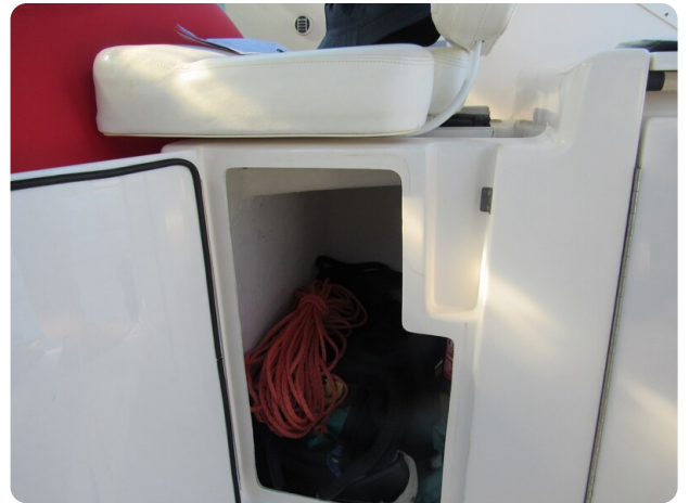
Tiara 3800 Open storage