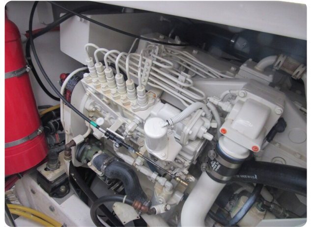
Tiara 3800 Open, engine room