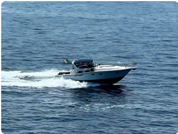
Tiara 3800 Open Cruising