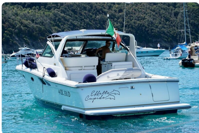
Tiara 3800 Open Effetto Cupido