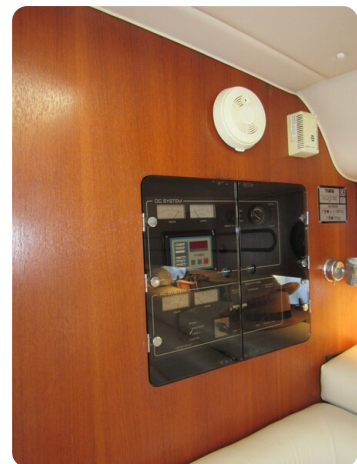
Tiara 3800 Open, electrical panel