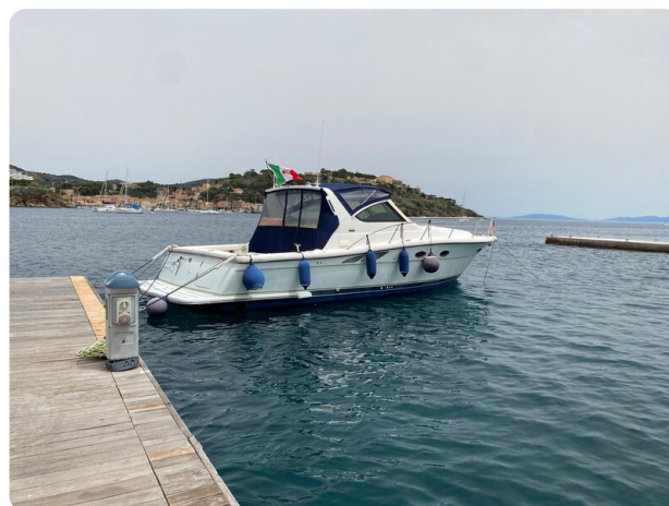
Tiara 3800 Open exterior