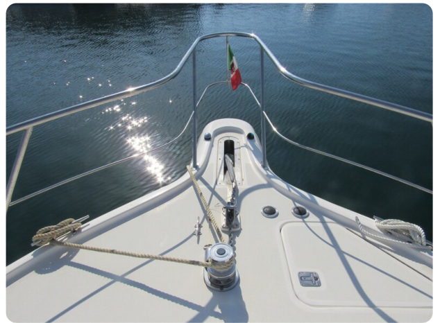
Tiara 3800 Open, bow pulpit