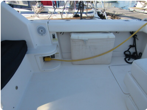
Tiara 3800 Open, cockpit details