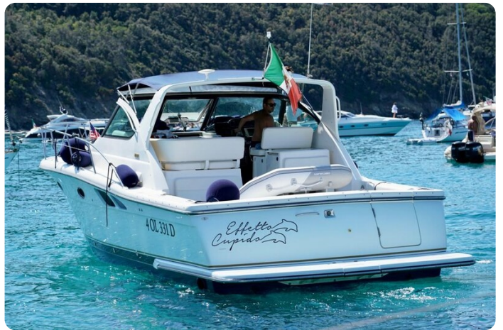
Tiara 3800 Open Stern