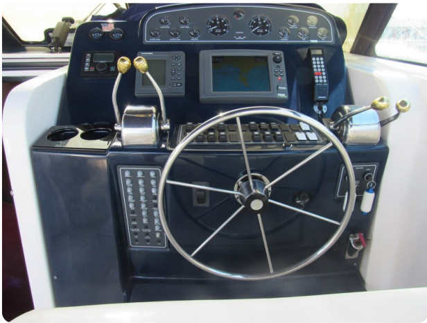
Tiara 3800 Open, helm