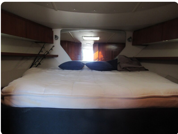
Tiara 3800 Open, berth