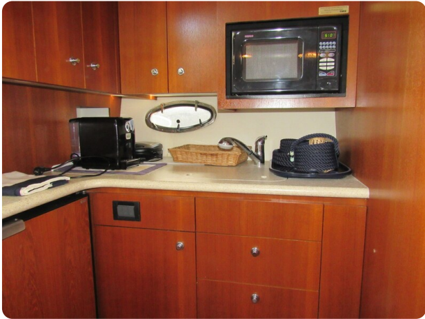
Tiara 3800 Open, galley