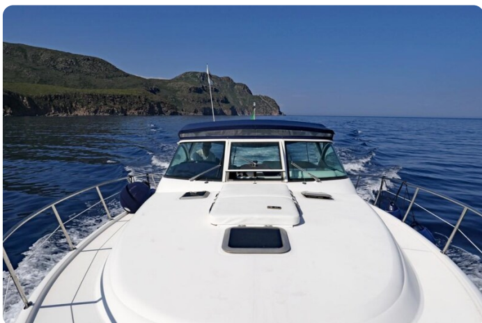
Tiara 3800 Open Bow