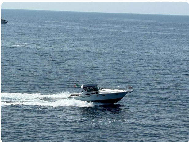
Tiara 3800 Open Run