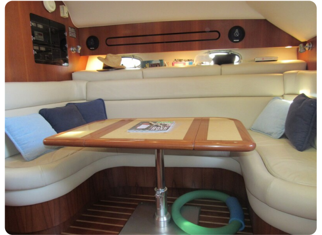
Tiara 3800 Open, dinette