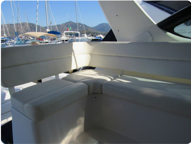
Tiara 3800 Open, cockpit lounge