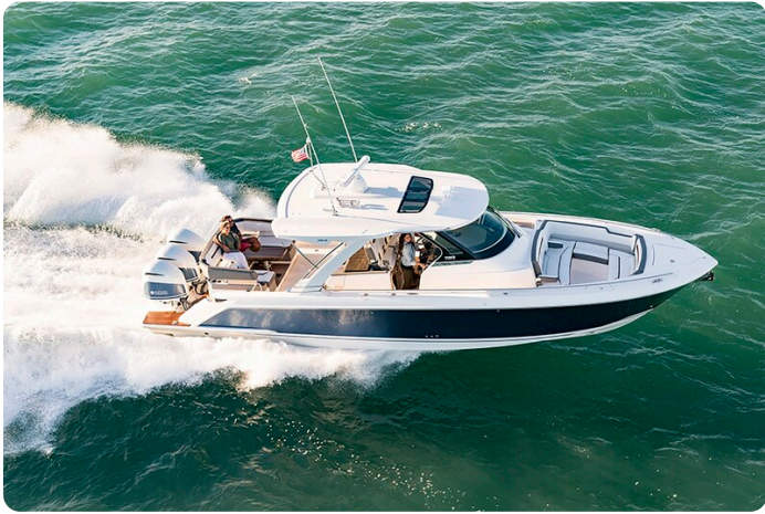
Tiara 38 LS aerial running