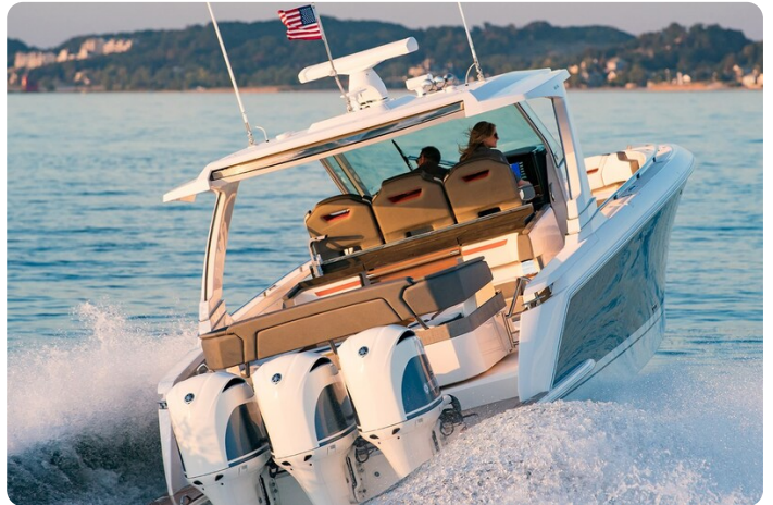
Tiara 38 LS sft running