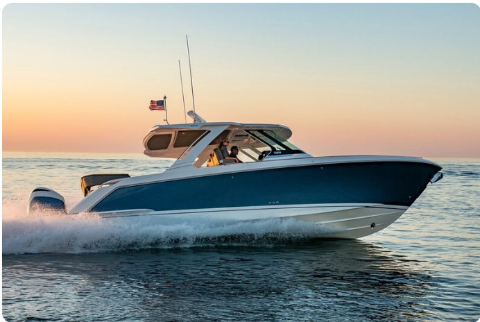
Tiara 38 LS running