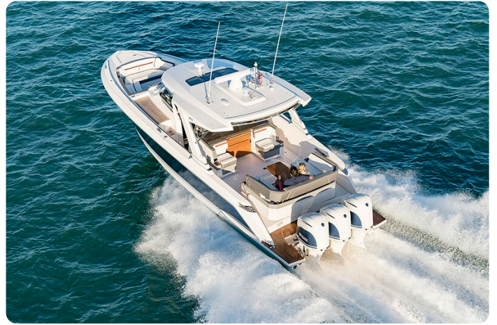
Tiara 38 LS aerial