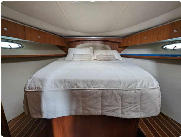
Tiara 3600 Open master cabin