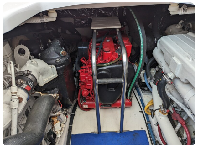
Tiara 3600 Open generator