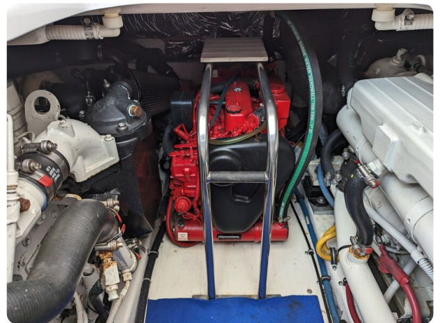
Tiara 3600 Open engine room