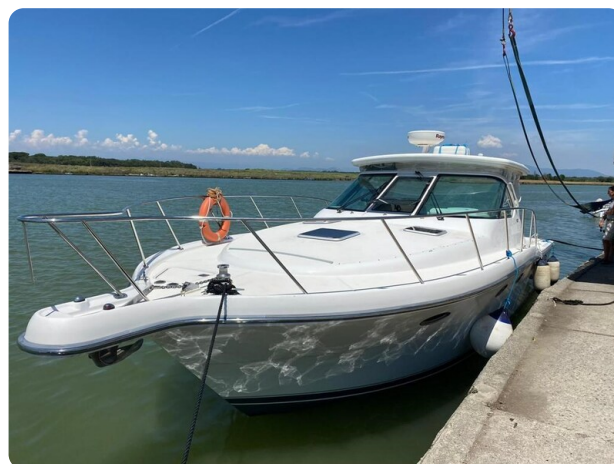
Tiara 3600 Open bow profile