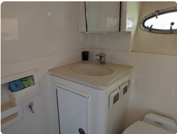
Tiara 3600 Open bathroom