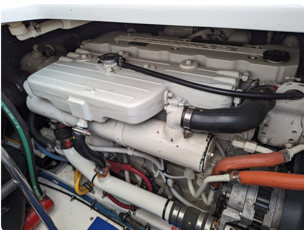
Tiara 3600 Open engine detail