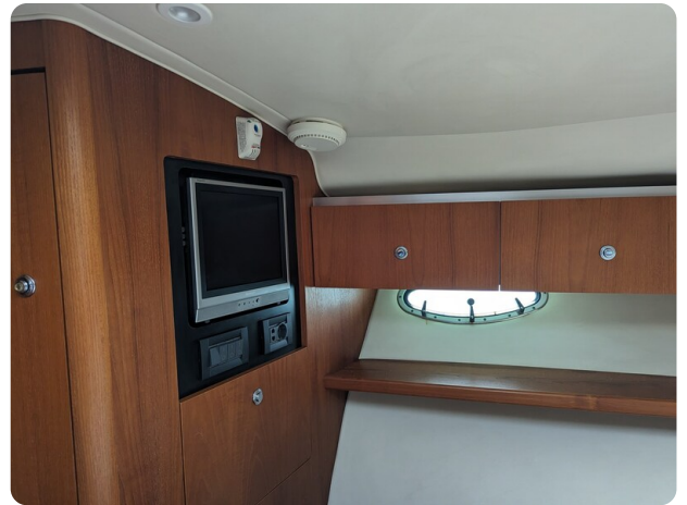
Tiara 3600 Open master cabin's TV