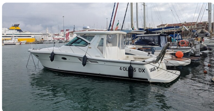
Tiara 3600 Open, profile