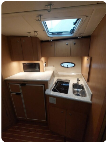
Tiara 3500 Open Sampei galley