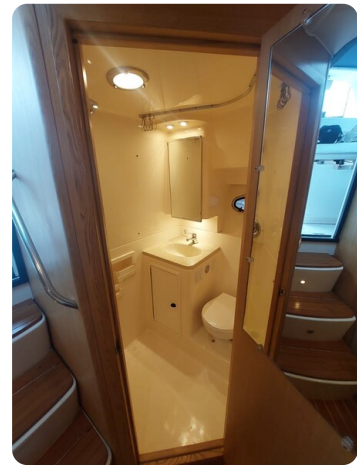
Tiara 3500 Open Sampei bathroom