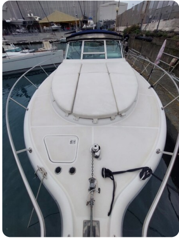
Tiara 3500 Open Sampei fwd deck