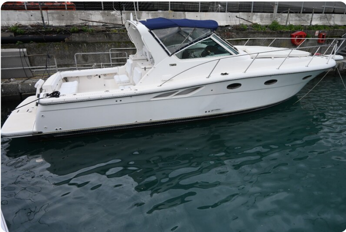
Tiara 3500 Open Sampei profile