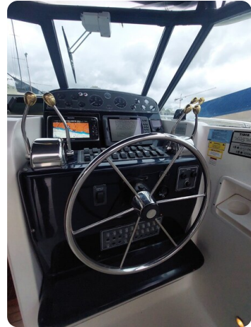
Tiara 3500 Open Sampei helm station