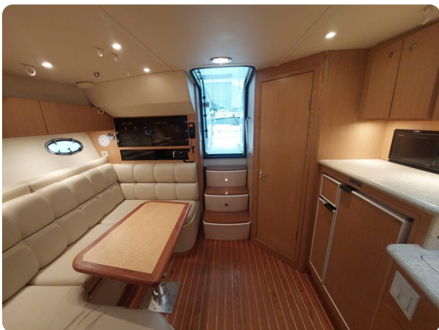
Tiara 3500 Open Sampei cabin view