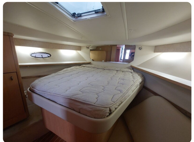
Tiara 3500 Open Sampei cabin