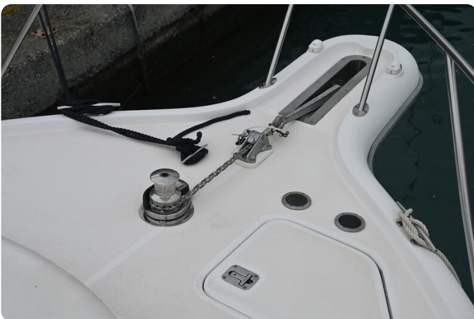
Tiara 3500 Open Sampei bow pulpit