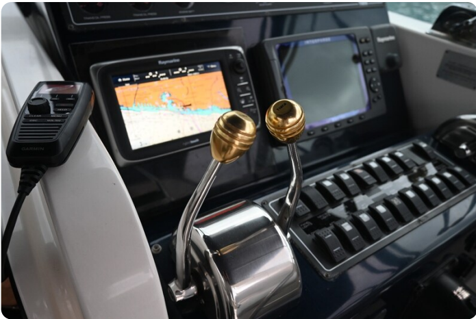
Tiara 3500 Open Sampei helm detail