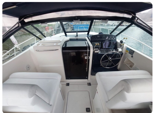
Tiara 3500 Open Sampei helm area