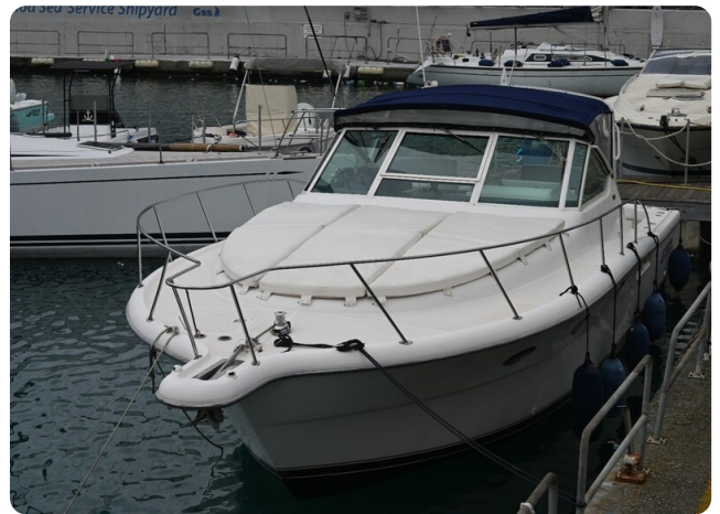
Tiara 3500 Open Sampei bow view