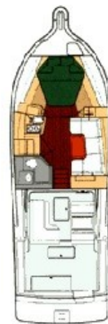
Tiara 3500 layout