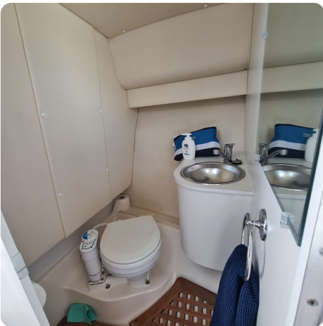
Tiara 2900 Coronet head