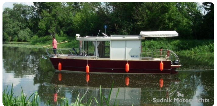
Hausboot SM 30 msp-398859 (22)