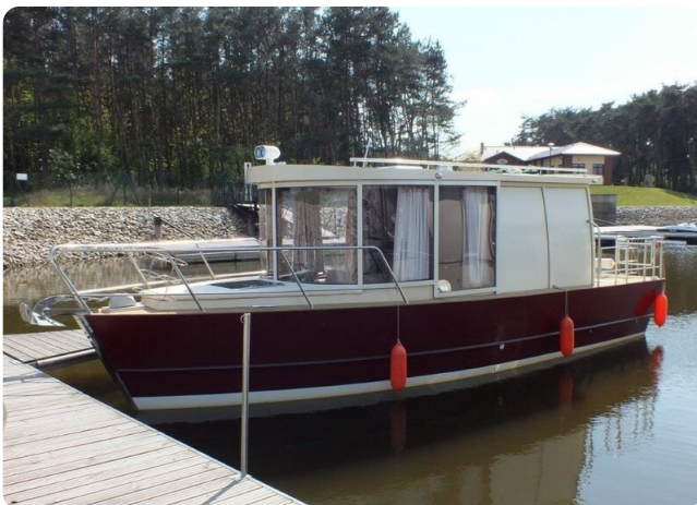
Hausboot SM 30 msp-398859 (23)