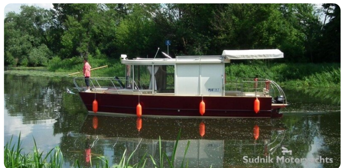
Hausboot SM 30 msp-398859 (22)