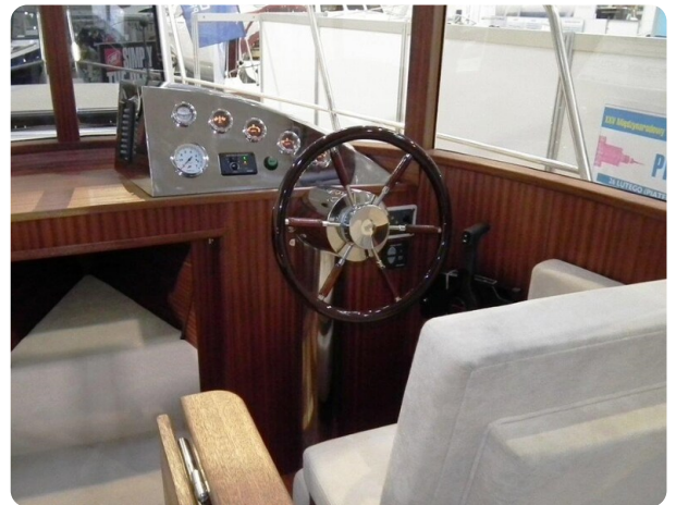
Hausboot SM 30 msp-398859 (19)