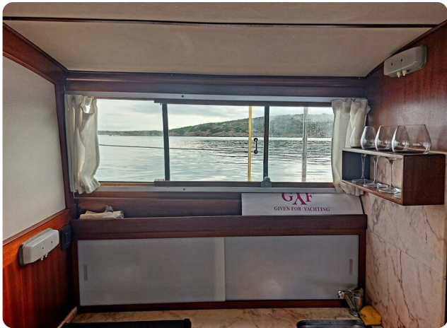
Storebro galley detail