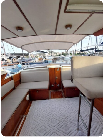
Storebro 34 exterior dinette