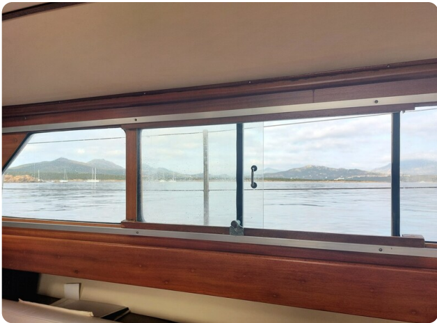
Storebro wide side windows