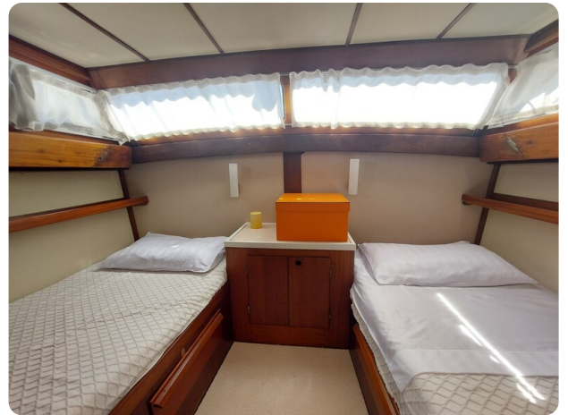
Storebro vip cabin1