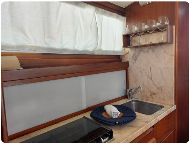
Storebro galley detail