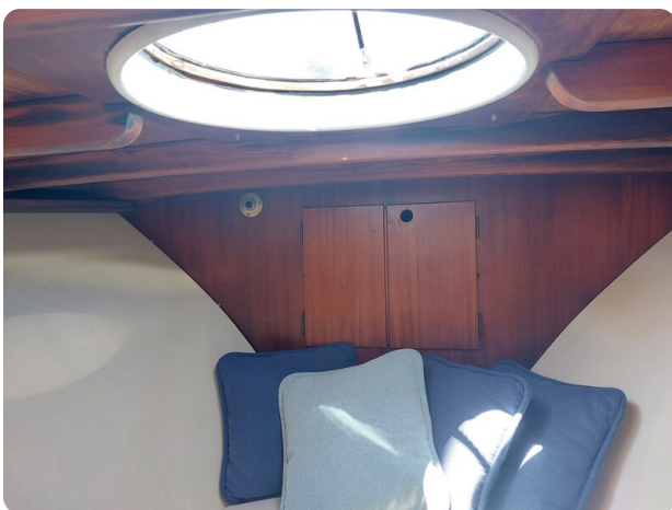
Storebro detail cabin