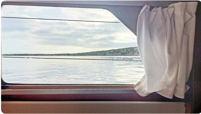
Storebro wc wide side windows