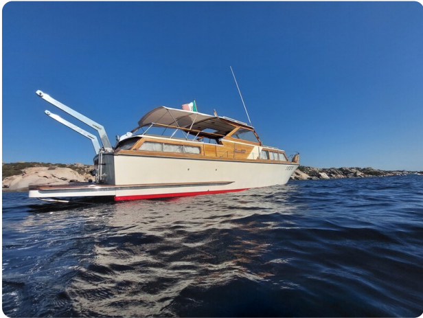
Storebro lateral view