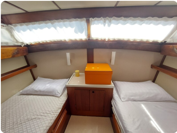
Storebro vip cabin