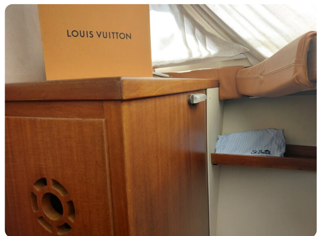
Storebro storage cabin