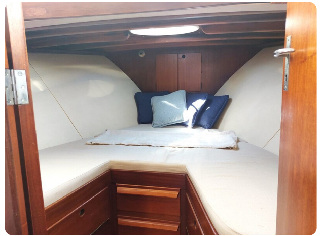
Storebro master cabin