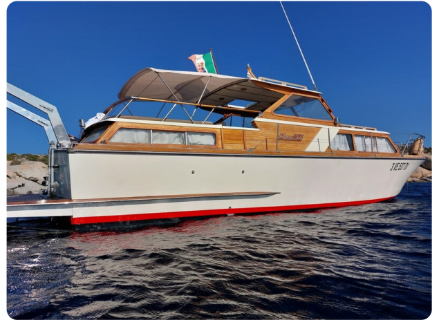
Storebro lateral v