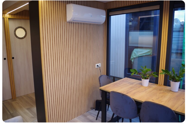
Shogun Hausboot 1000 22