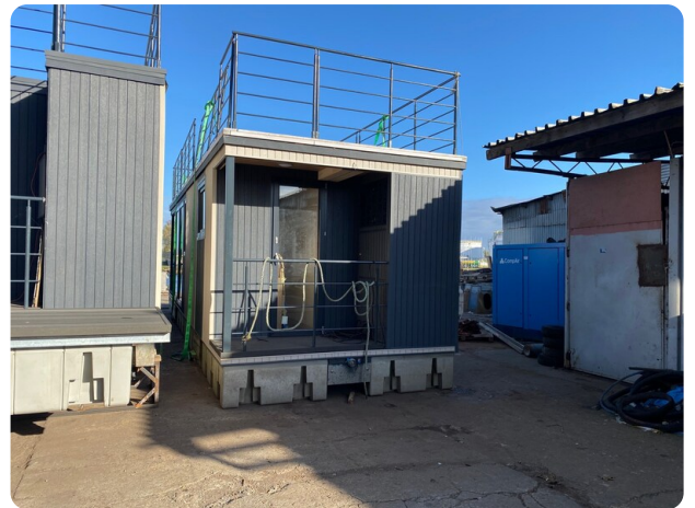
Shogun Hausboot 1000 14