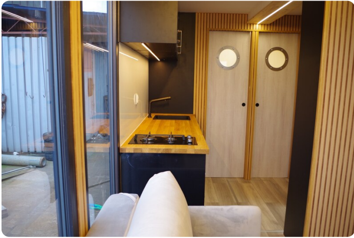
Shogun Hausboot 1000 21