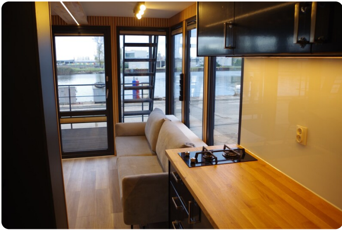
Shogun Hausboot 1000 19