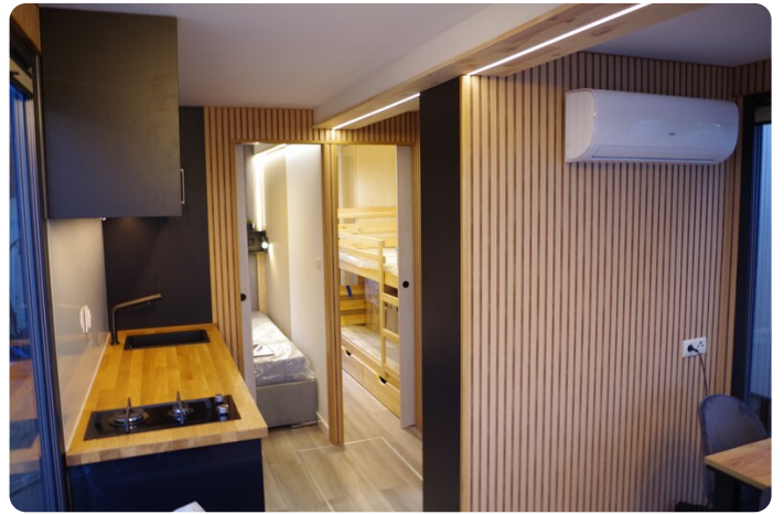
Shogun Hausboot 1000 20