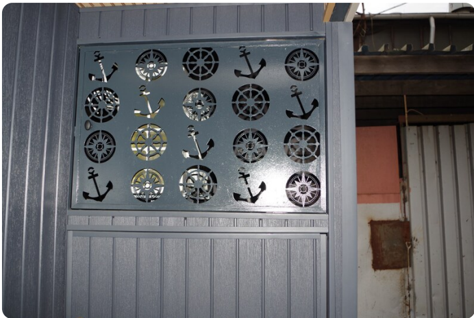
Shogun Hausboot 1000 23