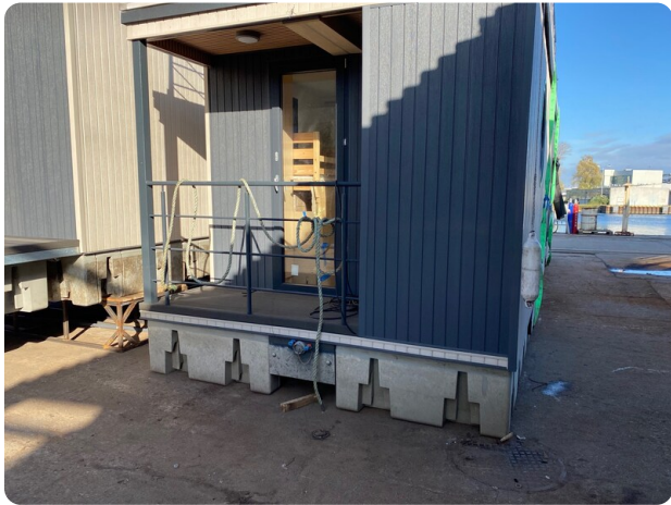
Shogun Hausboot 1000 2