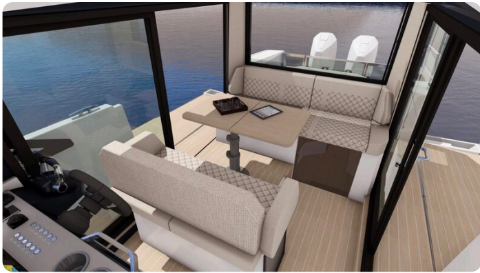
Saxdor 340 WA cockpit dinette