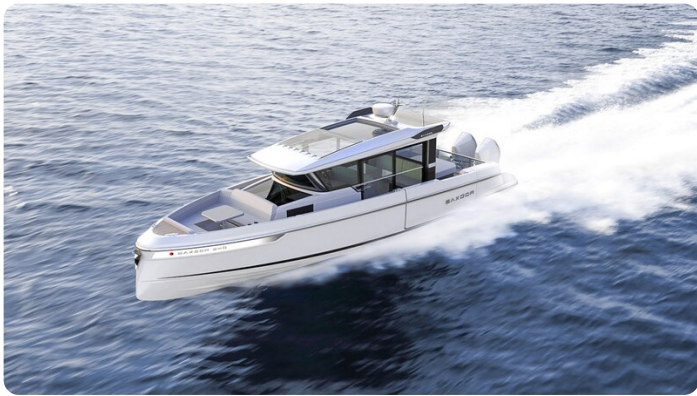
Saxdor 340 WA aerial view