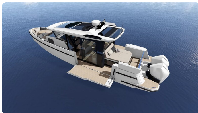
Saxdor 340 WA opened wings