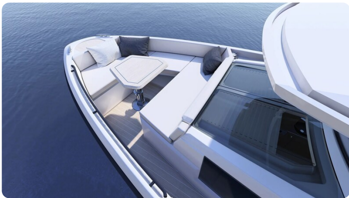
Saxdor 340 WA bow dinette