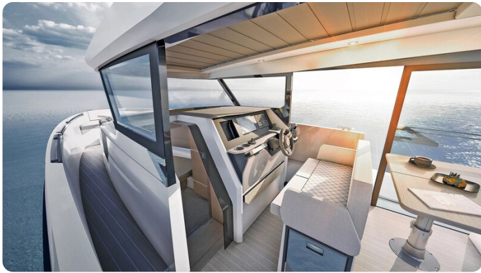
Saxdor 340 WA helm station