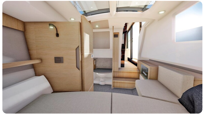
Saxdor 340 WA interiors