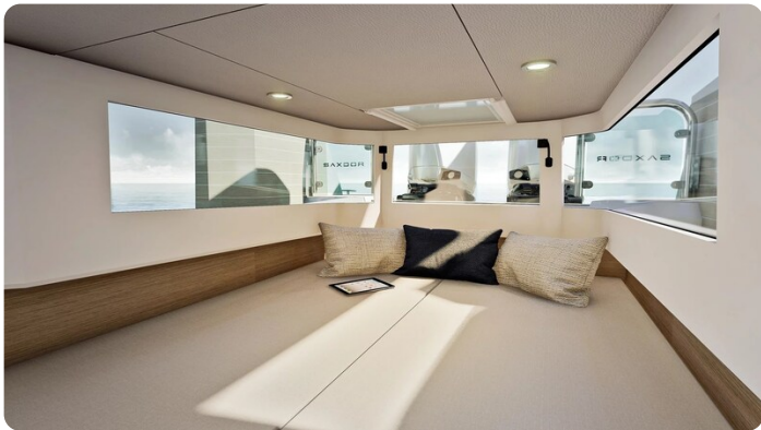
Saxdor 340 WA cabin