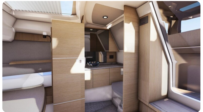
Saxdor 340 WA head