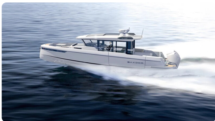
Saxdor 340 WA running