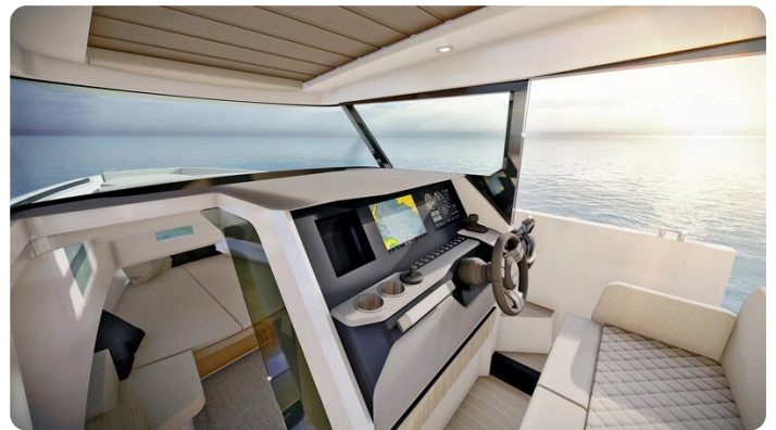
Saxdor 340 WA helm