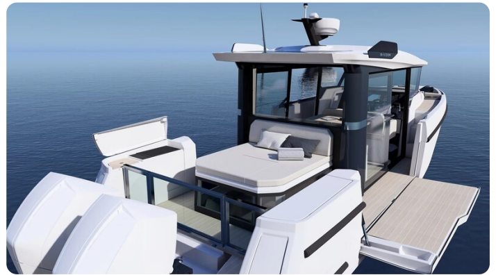
Saxdor 340 WA cockpit detail