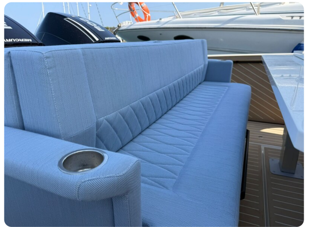
Saxdor 320 GTO Aft Seats