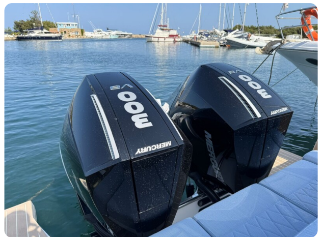
Saxdor 320 GTO Outboards