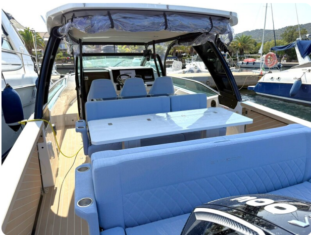
Saxdor 320 GTO Aft View