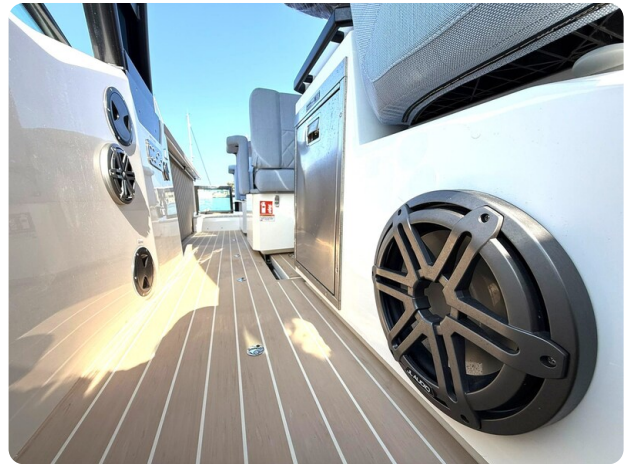
Saxdor 320 GTO Audio System