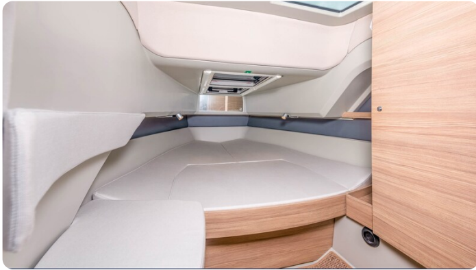
Saxdor 320 GTC cabin