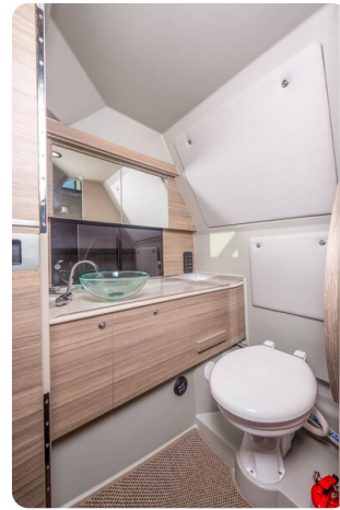
Saxdor 320 GTC head