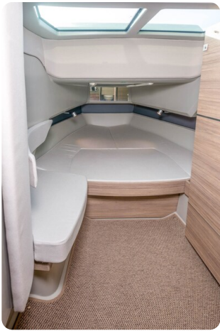
Saxdor 320 GTC cabin view