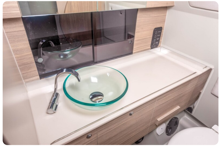
Saxdor 320 GTC bathroom