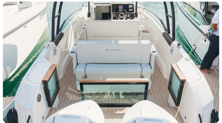
SAXDOR 270 GTO Stern