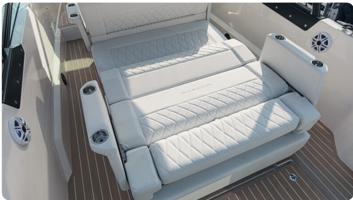
SAXDOR 270 GTO Convertible dinette