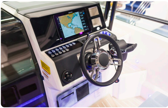
SAXDOR 270 GTO Helm