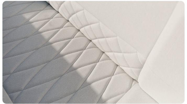
SAXDOR 270 GTO Sofa detail