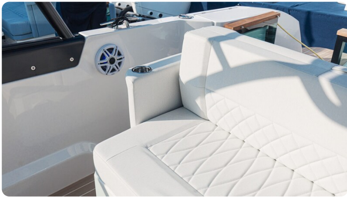
SAXDOR 270 GTO Sofa