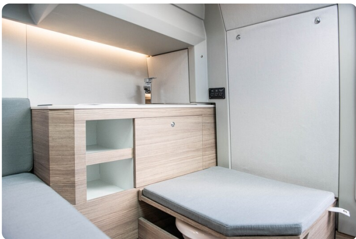
SAXDOR 270 GTO Toilette