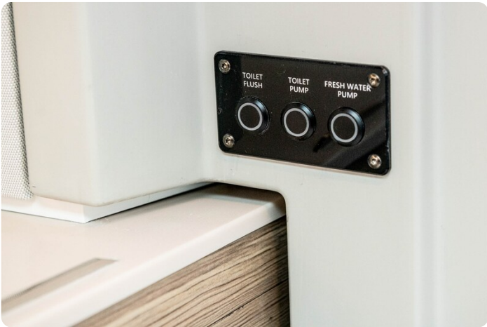
SAXDOR 270 GTO Electrical panel