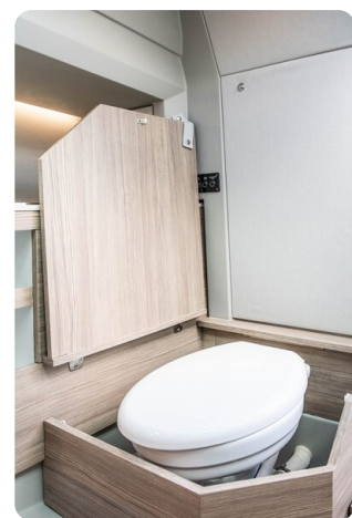
_SAXDOR 270 GTO Convertible toilette