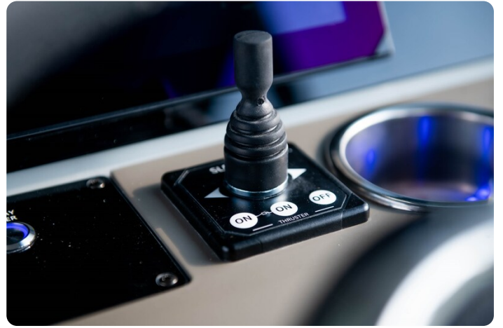
SAXDOR 270 GTO Bow thruster