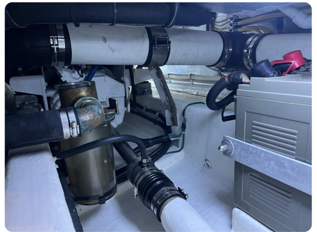
{I} Engine room