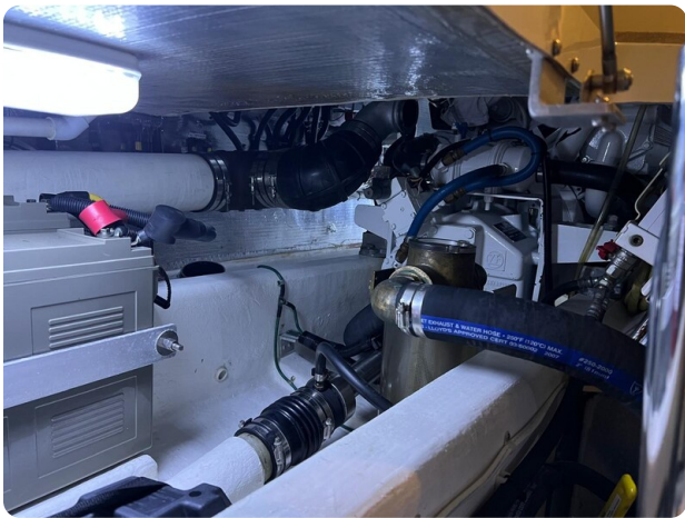
{I} Engine room