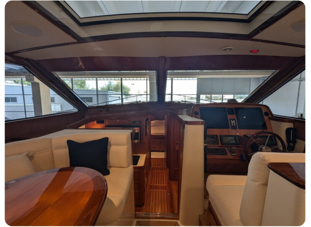
San Juan 48 dinette view