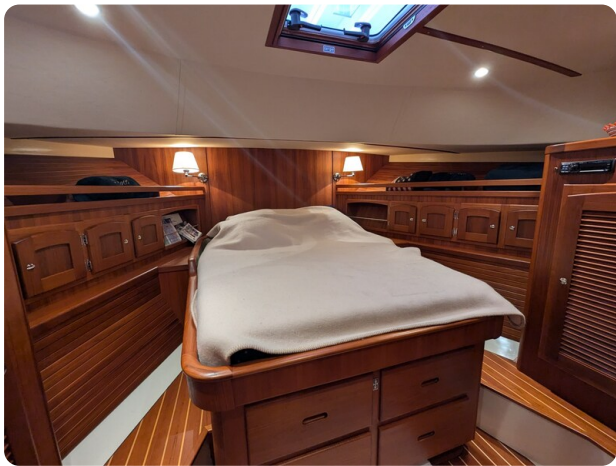
San Juan 48 master cabin