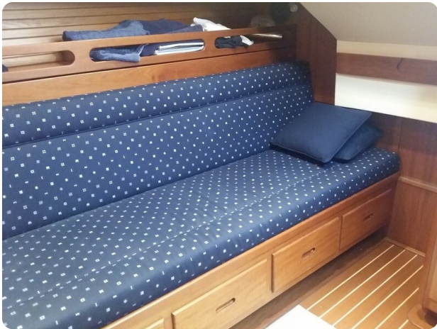
San Juan 48 lower dinette