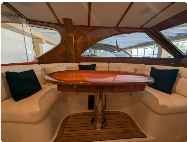
San Juan 48 dinette