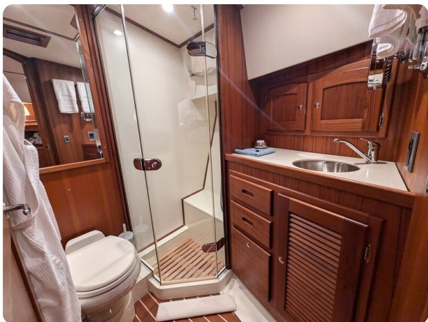
San Juan 48 bathroom