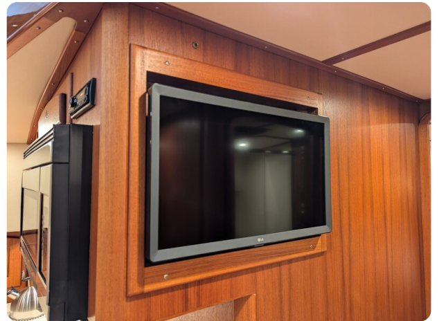
San Juan 48 lower dinette Tv