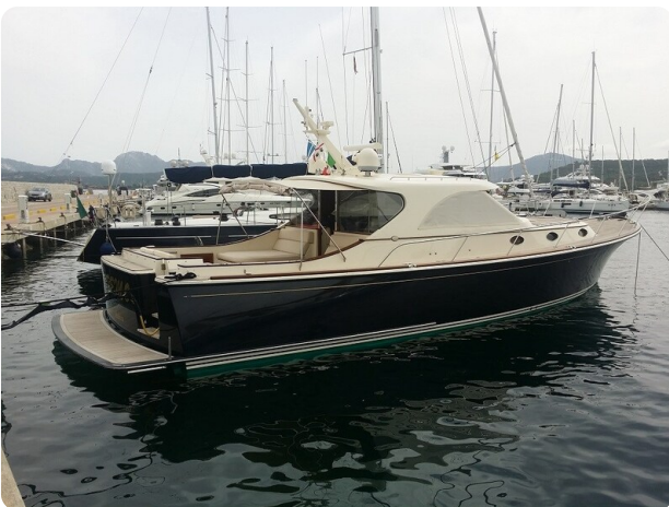
San Juan 48