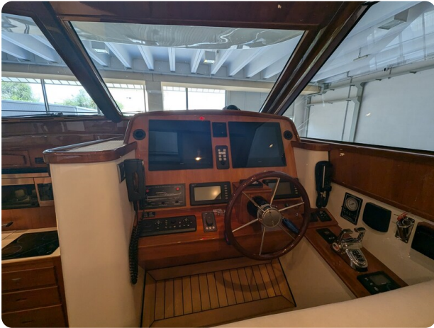
San Juan 48 helm station