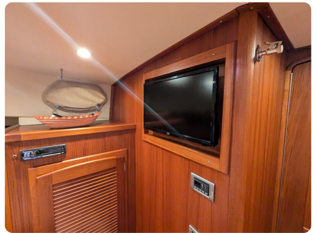
San Juan 48 master cabin Tv