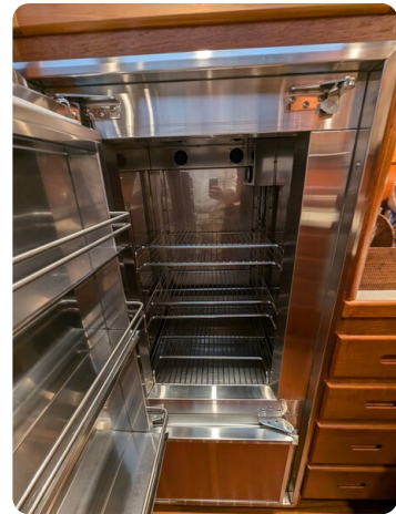
San Juan 48 refrigerator