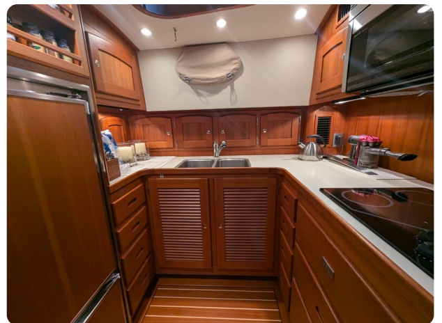
San Juan 48 galley