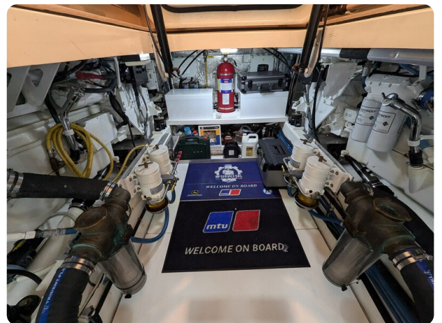
San Juan 48 engine room