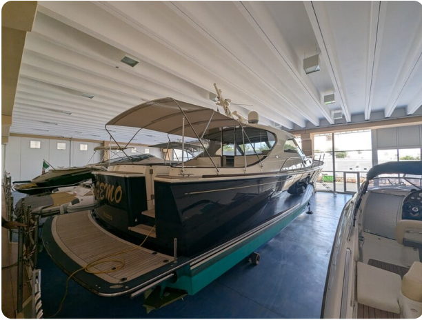
San Juan 48 drydock