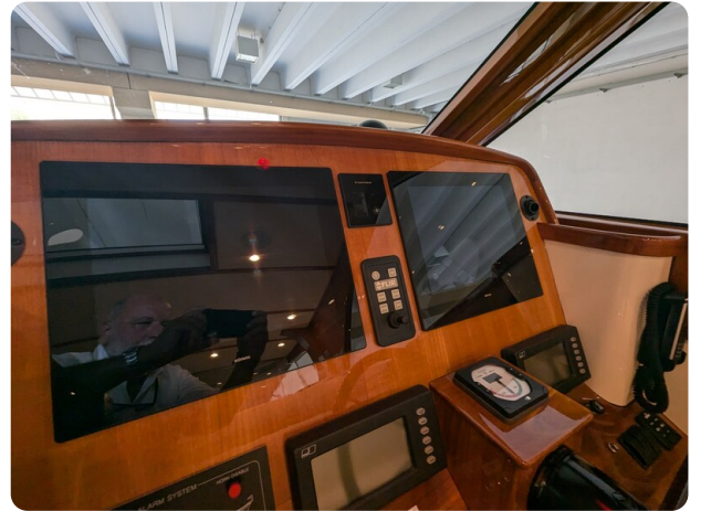
San Juan 48 helm detail