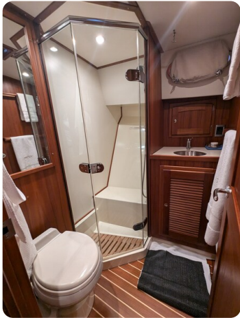
San Juan 48 head