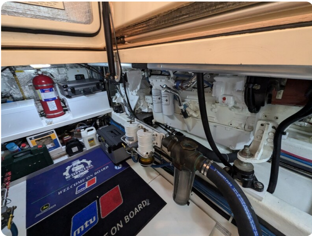
San Juan 48 engine room detail