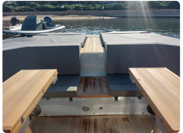
sacs strider 15-8