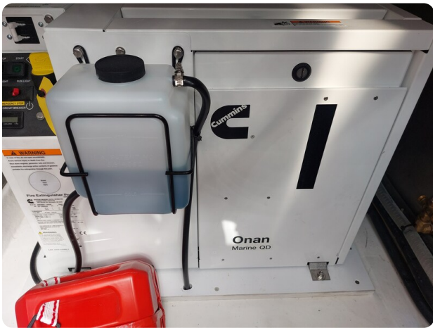
sacs strider 15-24