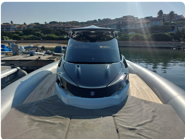
sacs strider 15-20