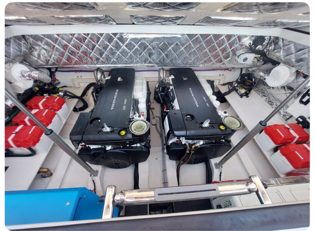
sacs strider 15-25