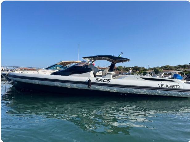
sacs strider 15-45