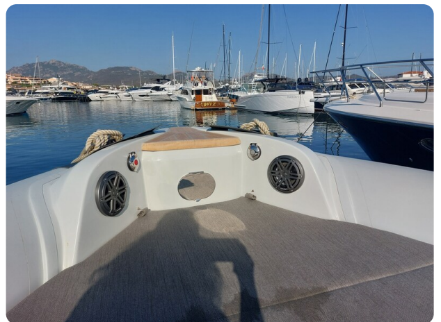
sacs strider 15-17