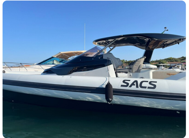
sacs strider 15-36