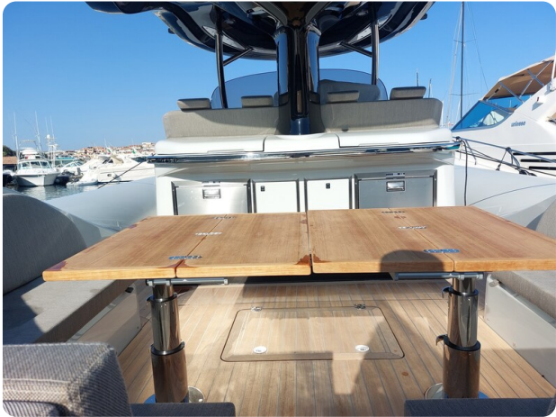
sacs strider 15-9