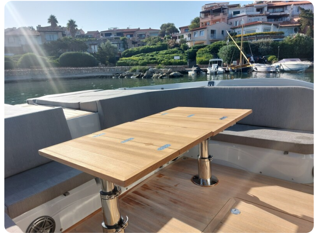
sacs strider 15-10