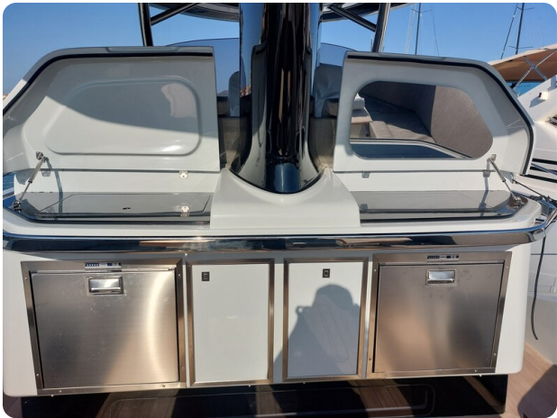
sacs strider 15-7