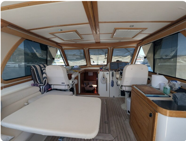
Sabre 42 Express upper cockpit view