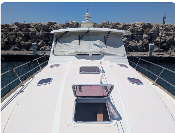
Sabre 42 Express fwd deck