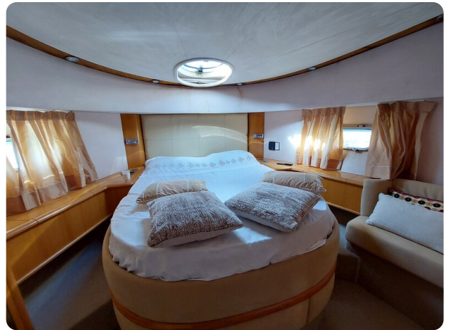
Rodman Yacht 64 Belisa, cabina vip