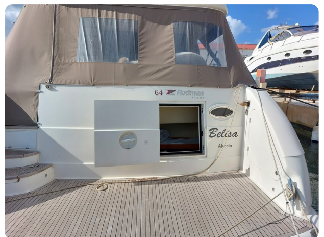
Rodman Yacht 64 Belisa, plancetta di poppa