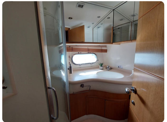
Rodman Yacht 64 Belisa, cabina vip bagno