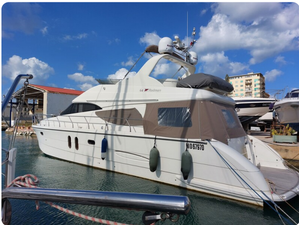
Rodman Yacht 64 Belisa, profile 1