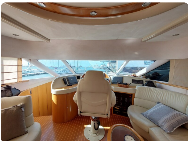
Rodman Yacht 64 Belisa, dedia di guida