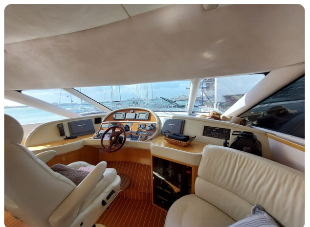
Rodman Yacht 64 Belisa, plancia comandi interno