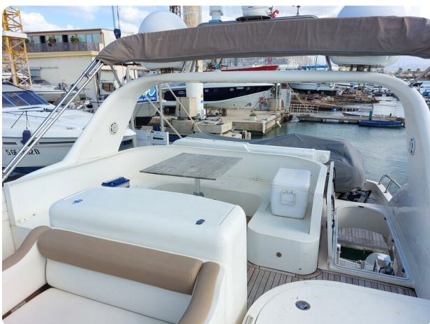
Rodman Yacht 64 Belisa, fly