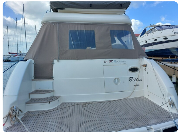
Rodman Yacht 64 Belisa, tendalino copri pozzetto