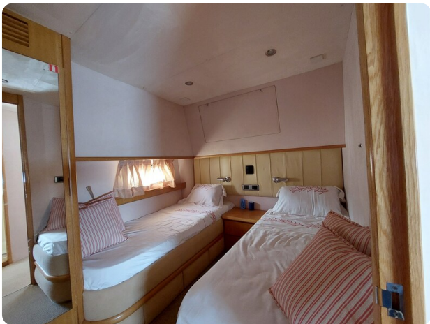
Rodman Yacht 64 Belisa, cabina twin