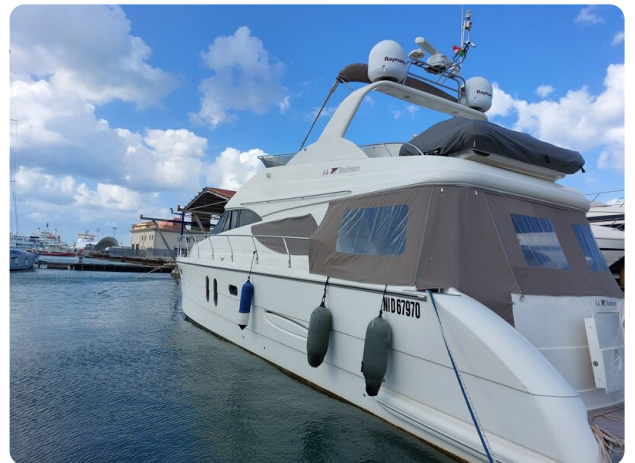
Rodman Yacht 64 Belisa, profile2