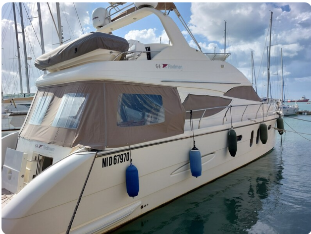
Rodman Yacht 64 Belisa, profile 3