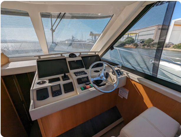
Riviera 45 Fly helm station detail