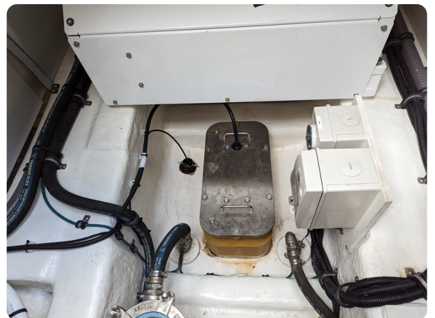
Riviera 45 Fly echo transducer