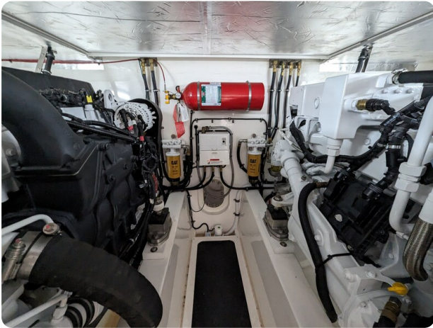
Riviera 45 Fly engine room