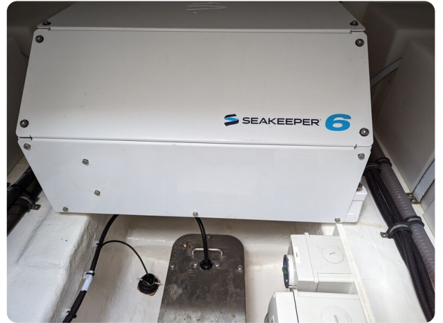
Riviera 45 Fly Seakeeper