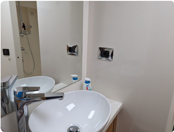
Riviera 45 Fly guest bathroom