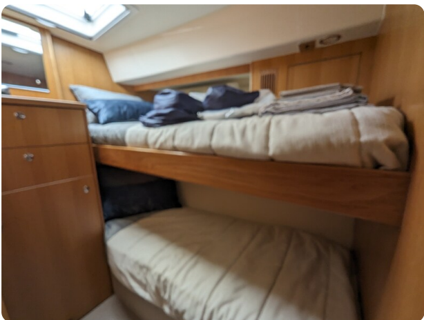
Riviera 45 Fly pullman berth cabin