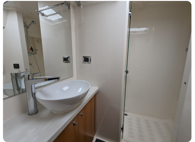
Riviera 45 Fly owner's bathroom