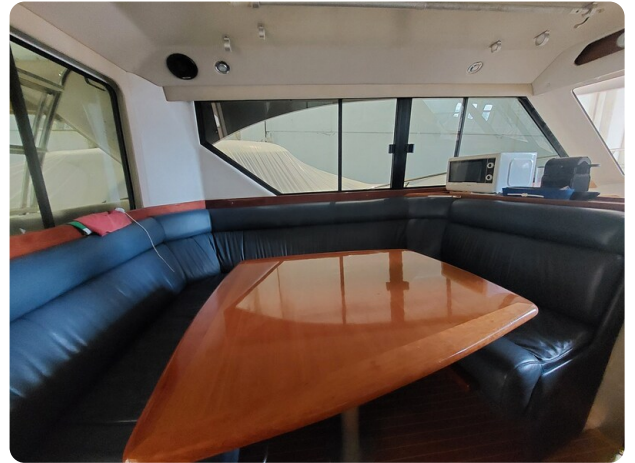
Riviera 33 fly dinette