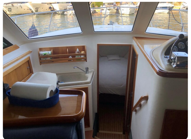
Riviera 33 fly cabin