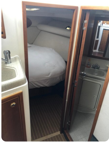
Riviera 33 fly toilet