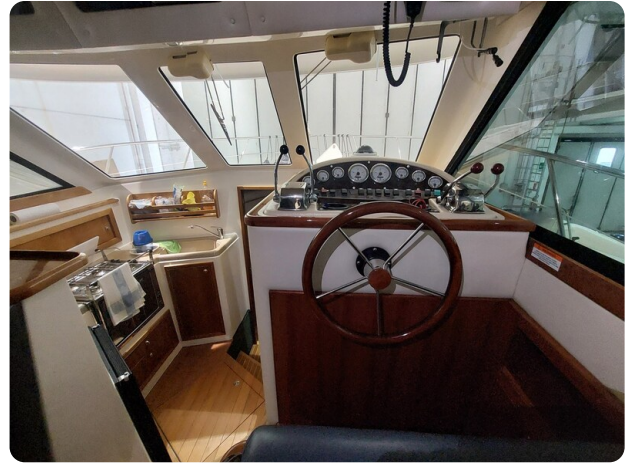
Riviera 33 fly 3