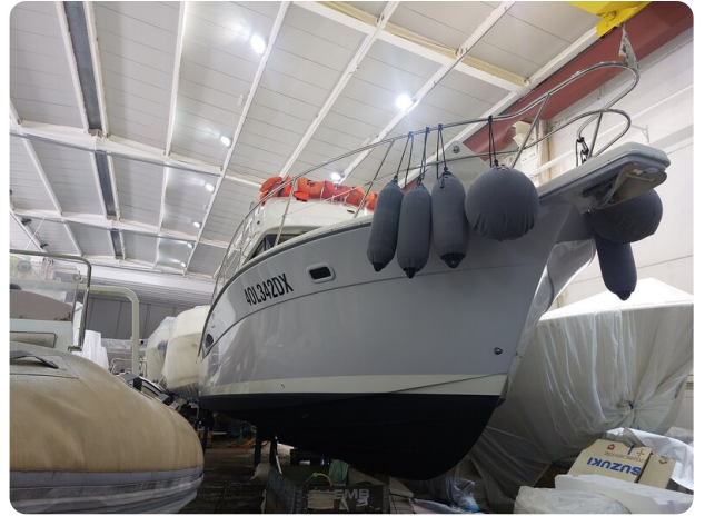
Riviera 33 fly hull