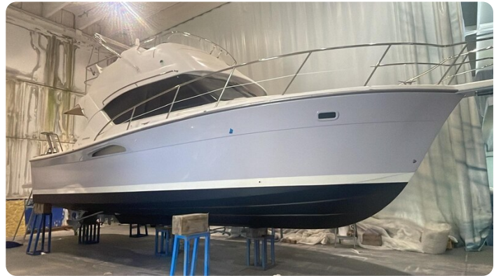
Riviera 33 fly hull 1