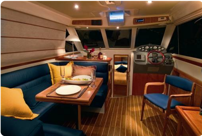
6Riviera 33 fly interior 1