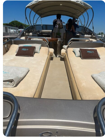
Rivarama aft sunpad