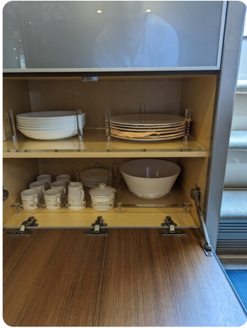
Rivarama Riva details