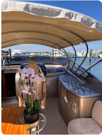
Rivarama cockpit detail