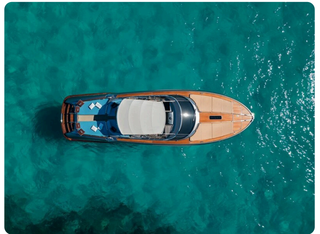
Rivarama Top View