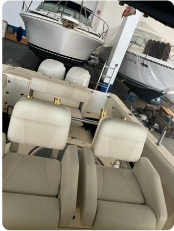
Pursuit C310 cockpit detail