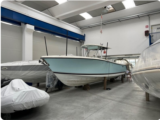
Pursuit C310 view