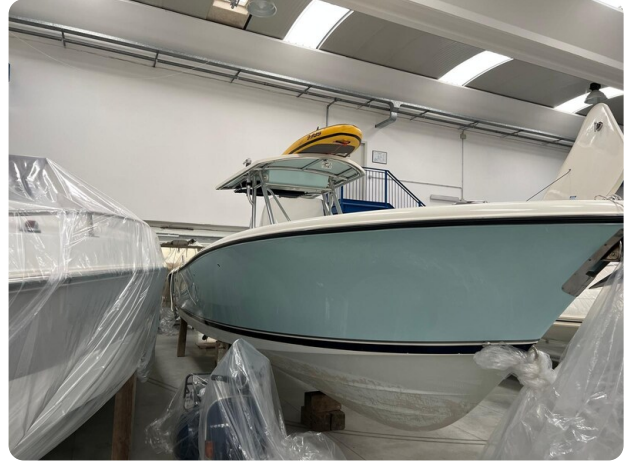
Pursuit C310 bow