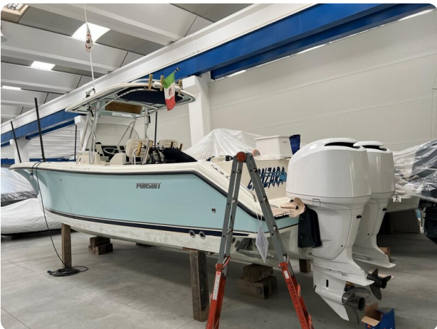
Pursuit C310 engines