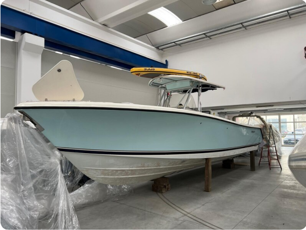
Pursuit C310 bow profile