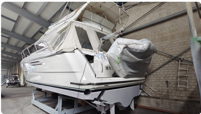
Princess 420 ARNO 35