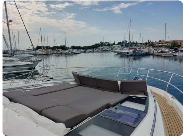
Prestige 630 Sissi