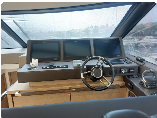
Prestige 630 Sissi