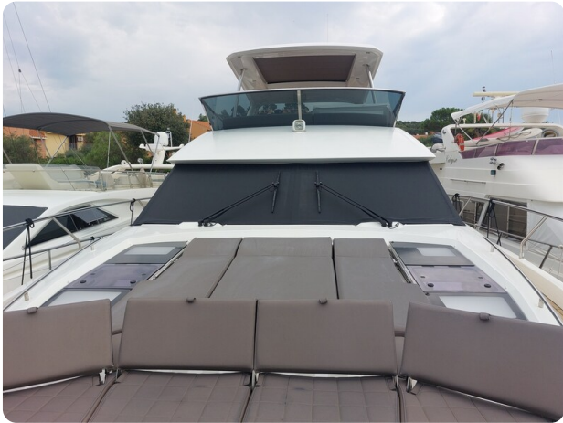
Prestige 630 Sissi