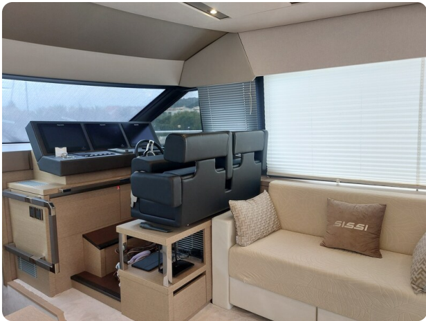
Prestige 630 Sissi