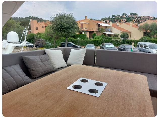
Prestige 630 Sissi