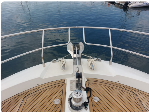
Prestige 630 Sissi