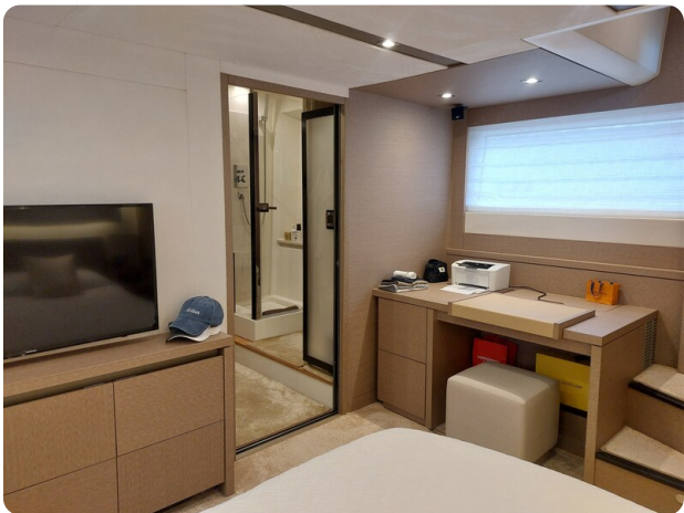
Prestige 630 Sissi