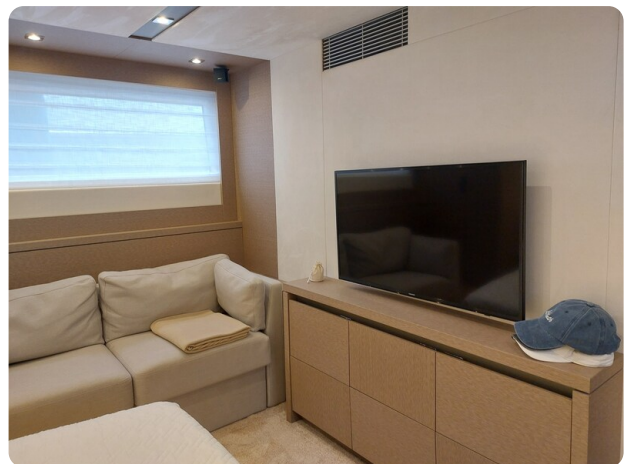
Prestige 630 Sissi