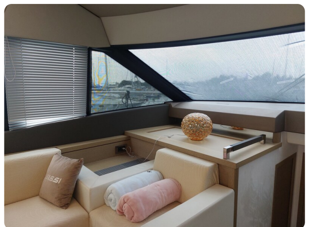
Prestige 630 Sissi