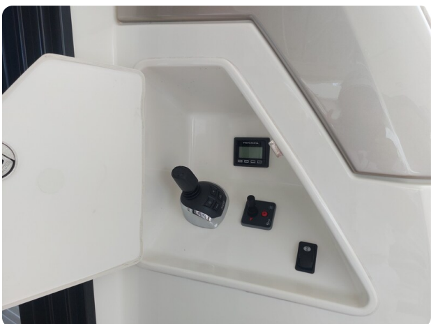
Prestige 630 Sissi