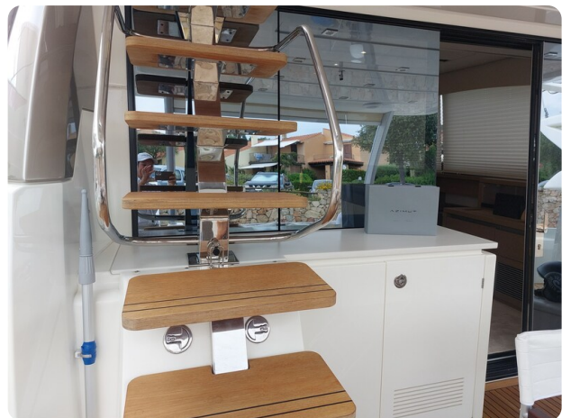
Prestige 630 Sissi