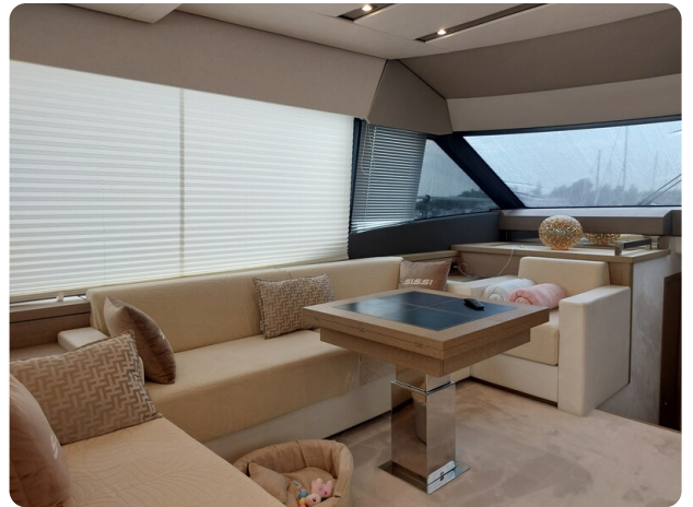
Prestige 630 Sissi