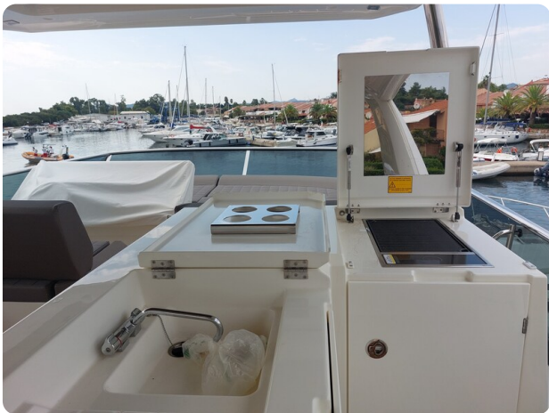
Prestige 630 Sissi