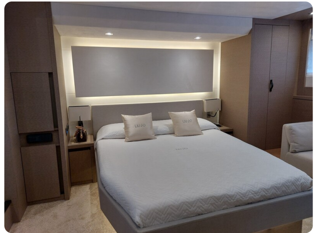
Prestige 630 Sissi