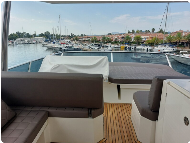
Prestige 630 Sissi