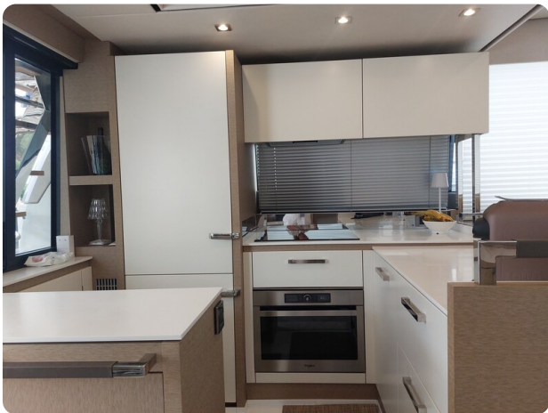
Prestige 630 Sissi