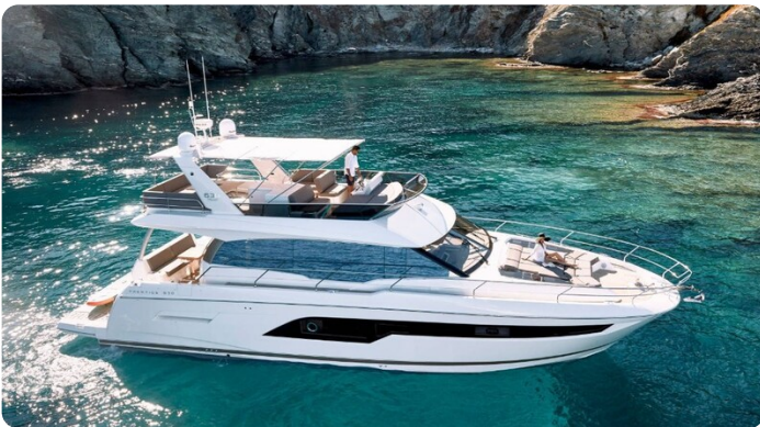
Prestige 630 Sistership