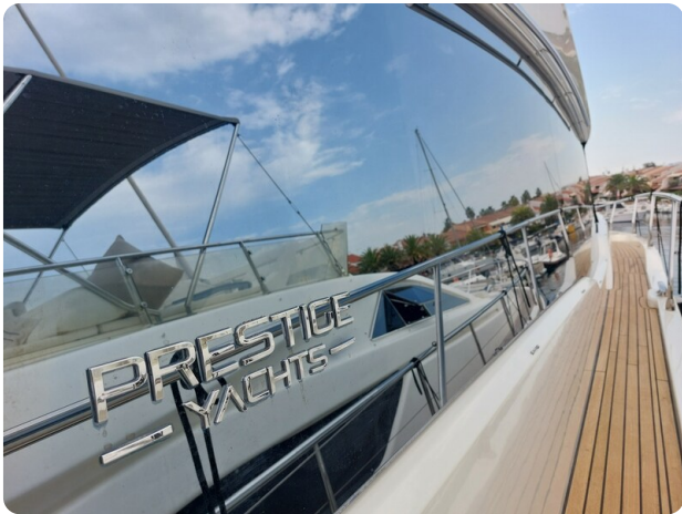
Prestige 630 Sissi