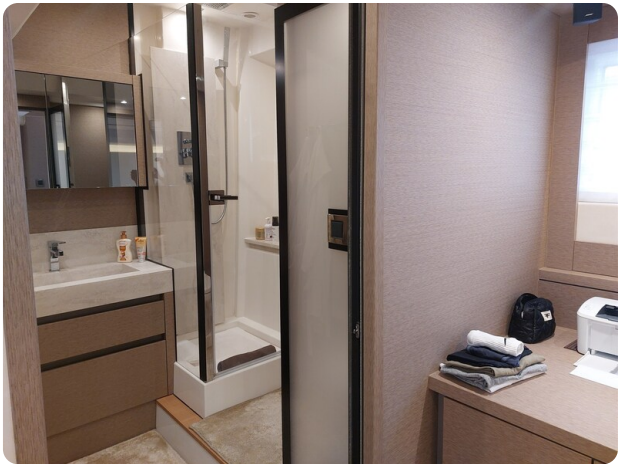
Prestige 630 Sissi