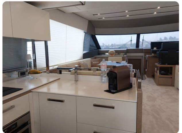
Prestige 630 Sissi