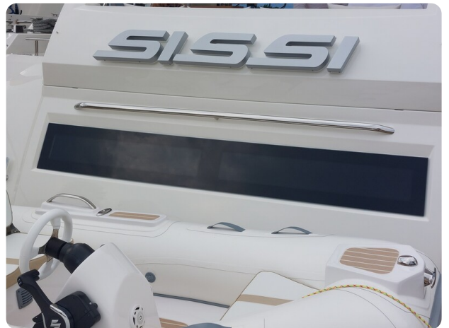
Prestige 630 Sissi