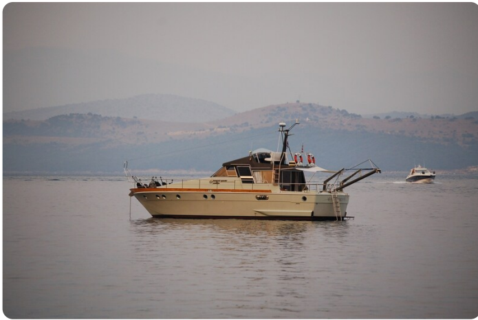
WN taverna nikolas corfu'1