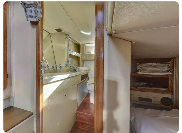
tobago 47 - Aft Cabin (1)