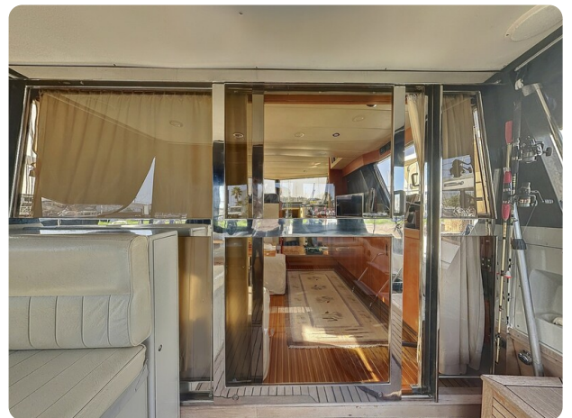
tobago 47 - Cockpit (1)