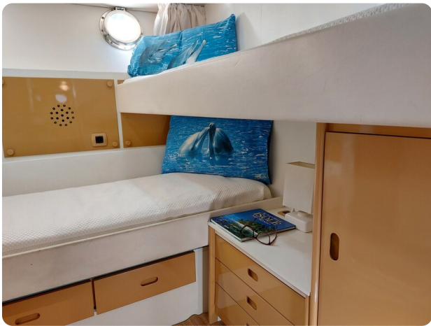
Picchiotti 68, Cabanon, cabina ospiti 1